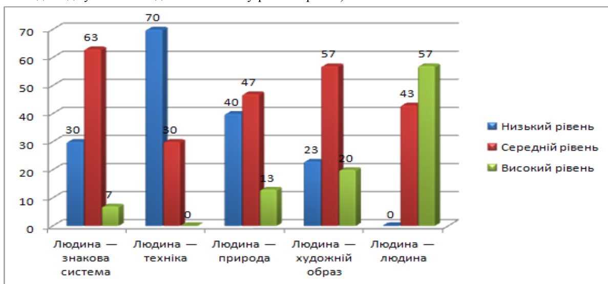
Рис. 2. Показники професійної готовності майбутніх психологів, які здобувають другу вищу освіту, 2 курсу навчання (n=60, у %)

Результати дослідження професійної готовності майбутніх психологів, які здобувають другу вищу освіту, навчаючись на 2 курсі, представлені далі (див. рис. 2).