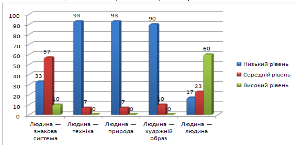
Рис. 1. Показники професійної готовності майбутніх психологів, які здобувають другу вищу освіту, 1 курсу навчання (n=60, у %)

про вираженість складових компонентів цієї готовності. Аналіз результатів за даною методикою подано у діаграмі (див. рис. 1).