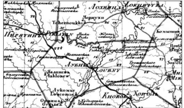
Фрагмент поштового тракту (Хорол – Лубни – Івановська – Пирятин) на «Генеральной карте Полтавской губернии 1821 г.» Фото

Під дубом крилатим тут грів свою душу, Шануй святе місце і інших напучуй, Бо тут те коріння, що дух наш гартує, Окрилює серце, насагу дарує».