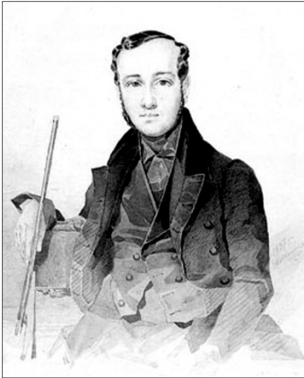
Тарас Шевченко. Портрет Євгена Павловича Гребінки, 1837

Історія села Лазірки на Полтавщині пов'язана із дружиною та донькою Є. П. Гребінки (1812–1848) – байкаря, поета, прозаїка.