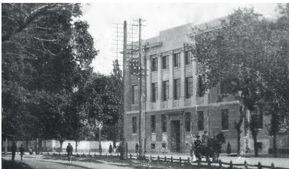
Гуманітарний корпус, 1928 – 1941 рр.

А тим часом, інститут із початку 1930 р. готувався до чергової реформи.