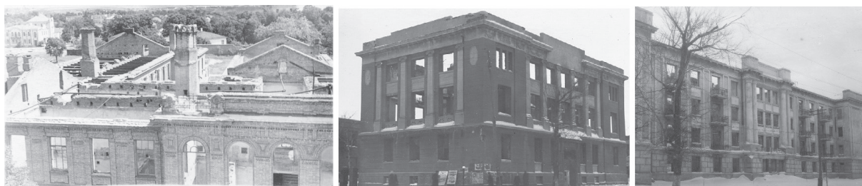
Корпуси ПДПІ в 1943-1944 рр.: №1; філфаку; студентського гуртожитку (зараз – №3)

Освітній процес у перші післявоєнні роки вівся у складних умовах: не вистачало аудиторій (заняття відбувалися в дві зміни, а до 1947 – 1948 н.р. не було електрики). Студенти працювали на прибиранні зруйнованих або дуже пошкоджених у вересні 1943 р. будівель (див. фото стану корпусу №1), на відбудові міста, в колгоспах; орендували при-