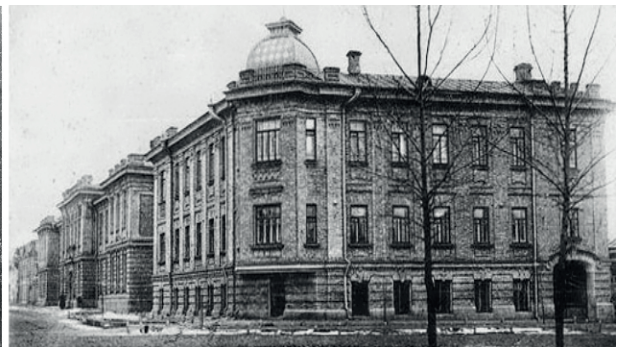
Корпус №1 у 1903 – 1943 рр.