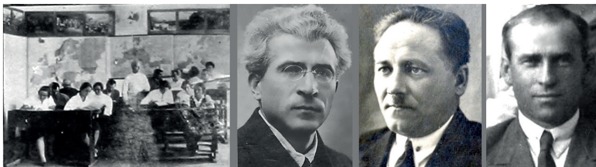
Кабінет суспільствознавства і методики його навчання