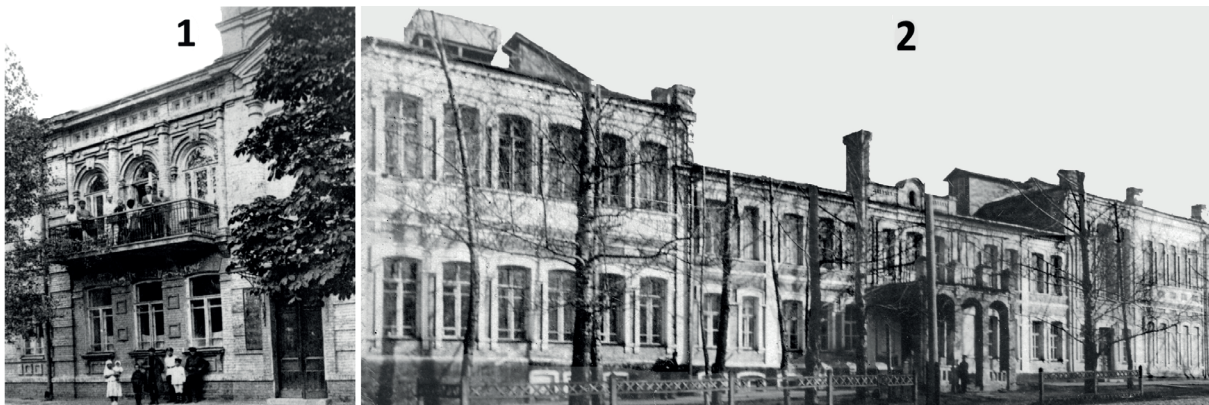
Будинки, де велася підготовка істориків і словесників :

І для істориків, і для словесників на факультеті викладали археолог, етнолог, мистецтвознавець Вадим Михайлович Щербаківський (1876 – 1957), Володимир Олександрович Щепот'єв (курс історії української літератури).