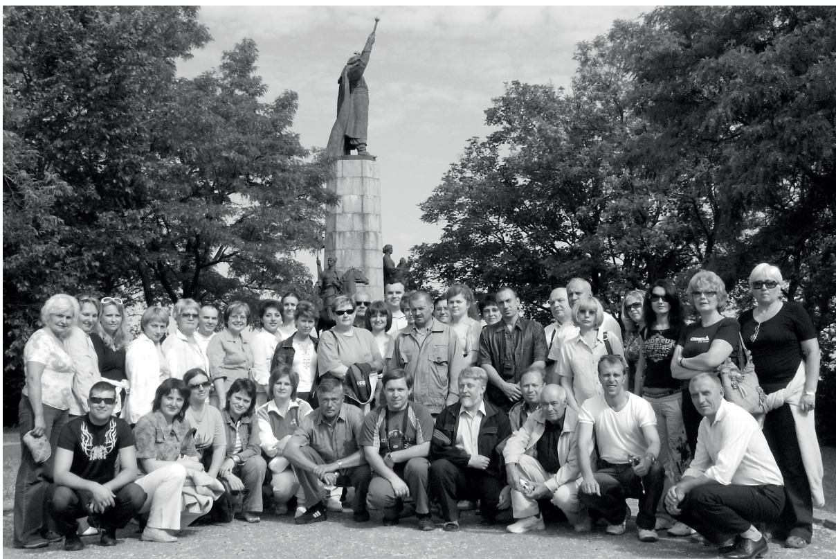
Експерсія викладачів факультету по Черкащині. Чигирин (2006 р.)

З 2002 р. при підготовці бакалаврів за ліцензованою спеціальністю «історія» відбувався розподіл на групи за спеціалізаціями «правознавство» або «суспільствознавство» (як правило 1 група); у 2007 – 2010 рр. – ще й із другою спеціальністю «географія».