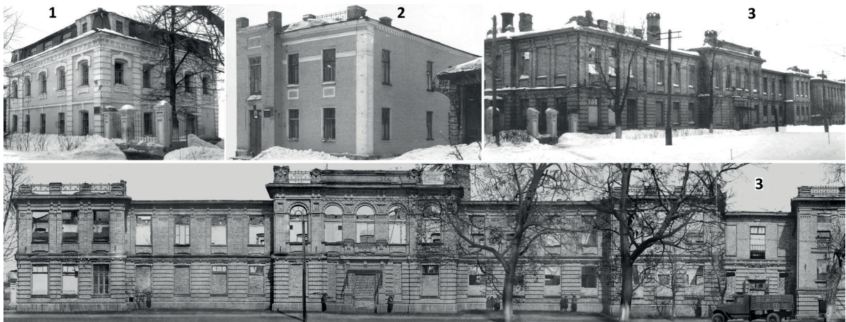
Будинки, в який велася підготовка вчителів історії: 1 – адміністративний корпус і природничий факультет (1946-1950), розібраний у середині 1970-х рр.; на його місці зараз права частина корпусу №2; 2 – По пров. Госпітальному, 10 (1950-1955); 3 – Корпус №1, вигляд до ремонту (1943-1955 рр.)

У 1950 р. Рада Міністрів УРСР прийняла постанову про те, що посада декана затверджується при наявності на даному факультеті контингенту студентів стаціонарного навчання не менше 200 осіб. Оскільки на історичному їх було всього 116, то з 20.10.1950 р.