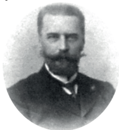
Петро Іванович Ковалевський

Колектив учительського інституту в травні 1919 р. розробив проект Статуту Педагогічного інституту (з метою реорганізації Учительського інституту на заклад вищої освіти, який було обіцяно надати в кінці квітня 1919 р. одним із керівників наркомату освіти УСРР під час відвідання Полтави). О.Т. Булдовський пише в звіті, що у середині липня 1919 р. один примірник Статуту повернувся в Полтаву з поміткою про затвердження завідувачем відділу вищої школи при Народному комісаріаті освіти УСРР. Заняття в інституті, який працював би за новим Статутом, мали б розпочатися після канікул, у вересні 1919 р. (25.08.1919 за старим стилем). До 15.08.1919 р. було запропоновано абітурієнтам обох статей подавати вступні документи (про закінчене навчання в учительських семінаріях або середніх школах). В оголошенні вказувалося, що коли залишаться вакансії, то особи без середньої освіти будуть прийматися з іспитом за курс 7-го класу жіночих гімназій. Набір пропонувався до трьох відділів: словесно-історичного, природознавчо-географічного і математичного. Цікаво, що заяви пропонувався подавати за адресою: Полтава, вул. Стрітенська №43 (що є ще підтвердженням слів Г.Г. Ващенко про фактичне злиття тоді двох закладів освіти).