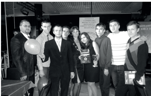
Команда з інтелектуальної гри «Брей-ринг» «Вендета» (2013 рік)

Серед досить різноманітних форм виховної роботи у Полтавському національному педагогічному університеті імені В. Г. Короленка однією з найочікуваніших, найнаситініших і найулюбленіших студентами є Тижні факультетів. Оскільки Тижні факультетів