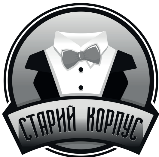
Емблема творчої групи «Старий корпус»

на кубку факультету, але саме Д. Вознюк зумів уперше завоювати першість на факультетському етапі та гідно представити факультет на кубку ректора з КВН 2019.