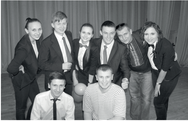
Команда КВК історичного факультету «Кип'яток» (2014 рік)