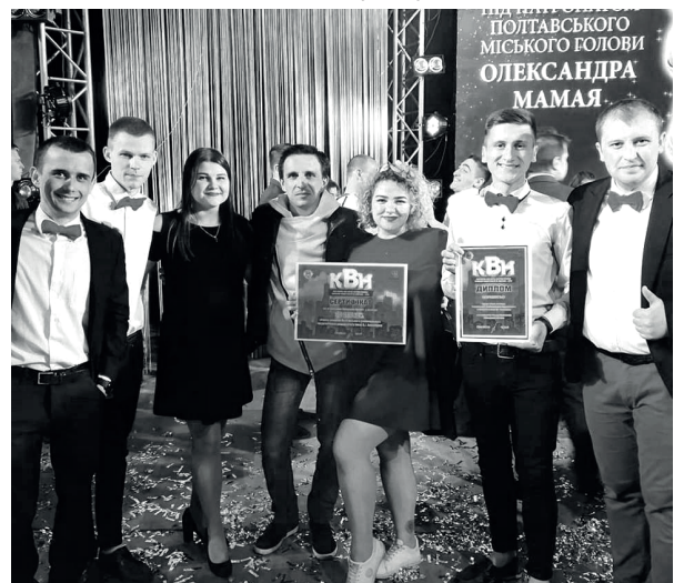
Творча група «Старий корпус» на фестивалі КВН серед закладів вищої освіти м. Полтави на кубок міського голови 2018 р.