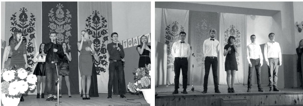
Гала-концерт «Зірки істфаку» (2014, 2018 роки)

3. Щорічні екологічні проекти «Охорона водоймищ Полтави», «Зроби Україну чистою» дозволяють щовесни облаштовували не лише територію прилеглу до університету, а й місто.