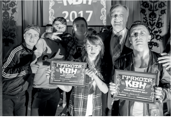
Команда КВК історичного факультету «Вендета» (2017 рік)

конкурсу професійних театральних колективів «Слобожанська фантазія-2016» (Суми), Диплом II ступеня за найкращий акторський колектив Всеукраїнського конкурсу професійних театральних колективів «Слобожанська фантазія-2016» (Суми), Гран-прі Міжнародного конкурсу «Фестивальний марафон-2016» (Дніпро), диплом в номінації «За залучення до українського театру нового драматичного репертуару у Всеукраїнському конкурсі «День театру» (м. Київ).