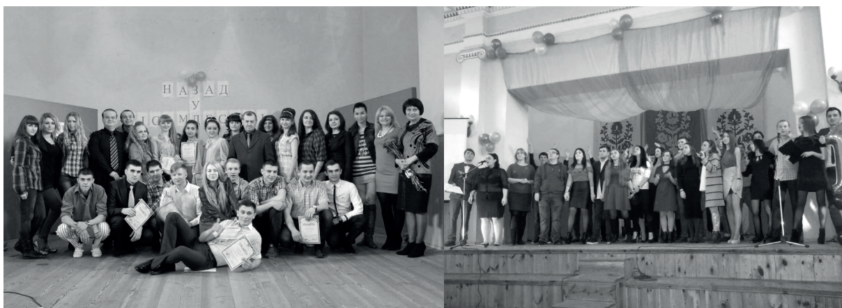
Художня програма випускників історичного факультету «Сто днів до наказу» (2014, 2018 роки)

2. Акція «Діти – Дітям», флеш-моби «Подаруй щастя дитині», «Зроби світ кольоровим» та численні благодійні студентські ярмарки дозволяють збирати речі та кошти для дітей-сиріт, безхатченків, малозабезпечених сімей і пацієнтів онкогематологічного відділення міської клінічної лікарні.