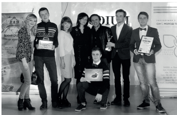
Команда з інтелектуальної гри «Брей-ринг» «Вендета» (2018 рік)