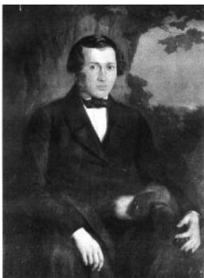
Є. П. Гребінка. Портрет роботи А. М. Мокрицького, 1840 р.

Новицького, однокласника за Ніжинською гімназією вищих наук князя Безбородька – Мар’яна. Позналилися вони влітку 1831 року в садибі її батька в селі Снітин Лубенського повіту Полтавської губернії.