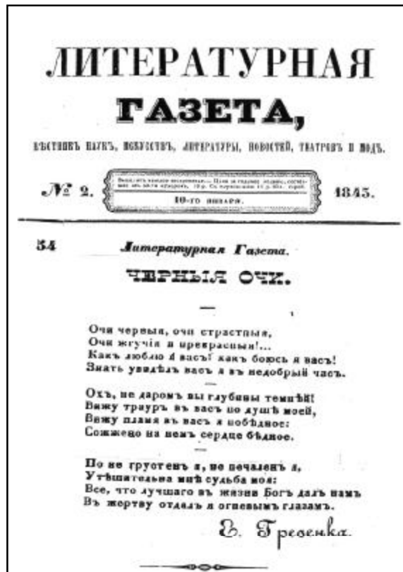
Автограф вірша Є. П. Гребінки “Черные очи”, вперше опублікований в “Литературной газете” від 10 січня 1843 р.

Слід наголосити, що поезія Гребінки ще за життя автора активно привертала до себе увагу видатних композиторів, співаків, диригентів. Так, майже одразу після публікації