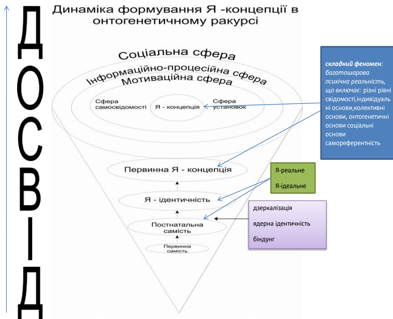
Рис. 5. Модель динаміки формування концепції Я в онтогенезі, яка зображає площини для регресивних психотерапевтичних інтервенцій

представити перебіг подій з позицій цього підходу (Адлер, 2001; Маслоу, 1998; Мей, 1994; Пріц, Викукаль, 2006; Grawe, 1992; Jakel, 2001; Kierein, Pritz, Sonneck, 1991).