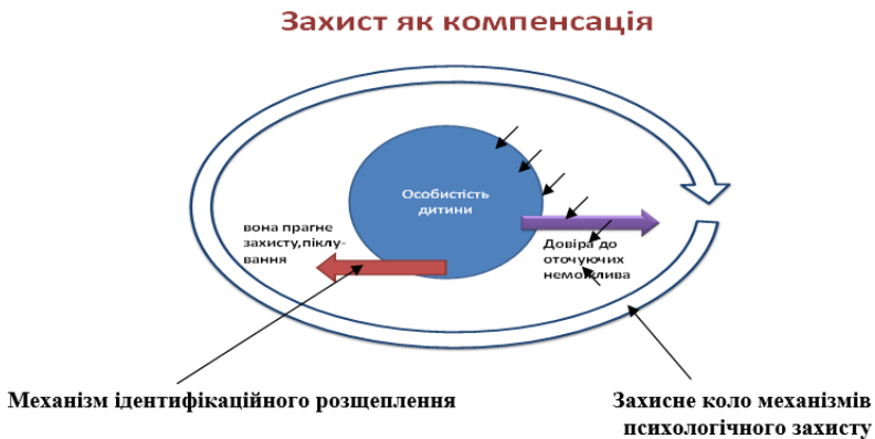
Рис. 2. Нарцисичний психологічний захист як компенсація

Як бачимо з рисунка, «кільце захисту» дає можливість особистості втриматись у межах власної психічної інтеграції, не зважаючи на викривлення сприйняття власних меж та інших взаємодій.