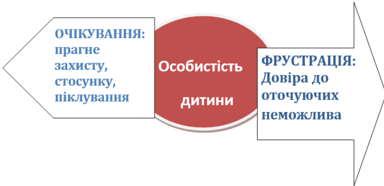
Рис.1. Модель особистісного розщеплення дитини

Намагаючись позбутись тривожності щодо «знищення або самознищення», ідентифікаційного розщеплення, особистісної деінтеграції, що виникає внаслідок відчуття загрози існування, дитина в процесі особистісного формування розвиває у собі невротичні захисти від неї (тобто систему блокування тривожності, так званий «захисний стратегічний кордон»). Найчастіше у зв'язку з цим явищем психоаналітики згадували про існування 10 нарцисичних захистів, які називали також невротичними потребами. Ці захисти сьогодні активно актуалізуються на всіх щаблях виховної сімейної, садкової, шкільної, ВНЗ та максимально затребувані у просторі дорослої взаємодії. Семантично вони відображаються у потребах у любові та схваленні, у керуючому партнерові, у чітких обмеженнях, у владі, в експлуатації, у суспільному визнанні, у захопленні собою, у честолюбстві, у самодоскональності та незалежності, у бездоганності та незаперечності. Ці потреби наявні у всіх людей без винятку (Франкл, 1990; Хьелл, Зиглер, 1997; Хорни, 1997; Lacan, 2005; Olds, 2006; Pritz, 2007), однак здорова людина на відміну від людини з нарцисичними дефіцитами використовує ці стратегії гнучко. У психотерапевтичному альянсі з клієнтами ми завжди зустрічаємось із патологічними змістами цих потреб. З огляду на необхідність відновлення інтрапсихічної та інтерперсональної рівноваги ми прагнемо допомогти клієнтам не лише вербалізувати, але й візуалізувати, опредметнити, унаочнити, поведінково відреагувати суть дефіцитів цих потреб.