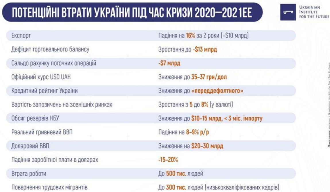
Рис. 2. За даними дослідження Українського інституту майбутнього [10]

На початку квітня 2020 р. проявилися такі основні зовнішні шоки та ефекти «зараження», які проникали до економік з ринками, що формуються, включаючи Україну: падіння світових цін на сировинні товари; охолодження світової економічної активності; наростання у світі протекціоністських настроїв і часткове закриття ринків для товарів українського експорту; падіння «апетиту до ризиків» міжнародних інвесторів і вплив іноземного капіталу з ринків, що формуються; збільшення фінансових спредів для ринків, що формуються, та критичне підвищення вартості зовнішнього приватного фінансування для українських корпорацій і уряду; часткове закриття ринків праці для українських трудових мігрантів і зменшення обсягів грошових переказів в Україну. У випадку України дуже небезпечним є накладення міжнародних ефектів «зараження» на попередньо сформовані зони вразливості національної економік [11]. Всі ці економічні негаразди потребують проведення виваженої державної економічної політики із застосуванням