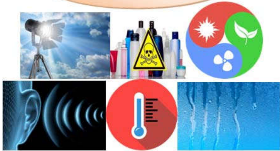
Рис. 3. Графічне представлення прикладів санітарно-гігієнічних чинників.