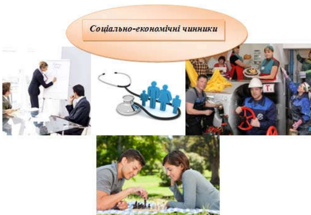
Рис. 6. Графічне представлення прикладів соціально-економічних чинників.