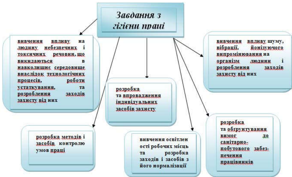
Рис. 1. Схема завдань з гігієни праці [2]