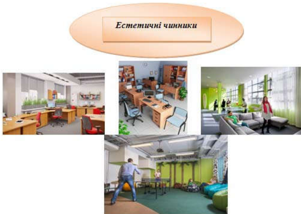
Рис. 7. Графічне представлення прикладів естетичних чинників.