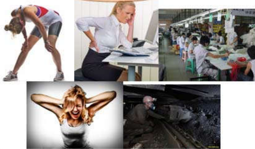
Рис. 4. Графічне представлення прикладів психофізіологічних чинників.