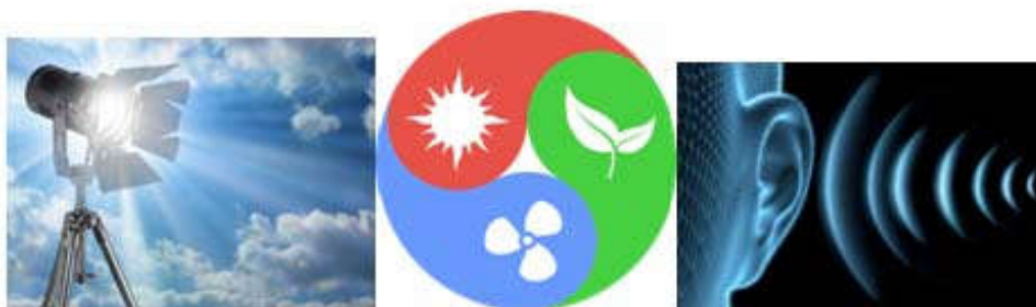
Рис. 8. Елементи санітарно-гігієнічних умов праці учасників навчально-виховного процесу.

Навчальні приміщення та робочі місця максимально сприятливо освітлюють, що має велике значення для забезпечення працездатності вчителів та дітей. Недостатнє освітлення пригнічує психіку і знижує гостроту зору, а отже, працездатність і якість навчально-виховної діяльності.