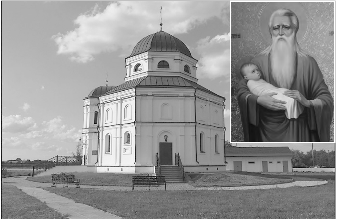
Храм Симеона Богоприїмця в селі Михайлики Шишацького району Полтавської області. Фото

гічним утіленням непересічних людських якостей та академізму творчості слід уважати справу останніх років – створення ікон для іконостасу храму Симеона Богоприїмця в селі Михайлики Шишацького району, збудованого за проектом відомого полтавського архітектора В. Трегубова й О. Белявської на землі славетних родин М. Гоголя, В. Короленка, В. Вернадського.