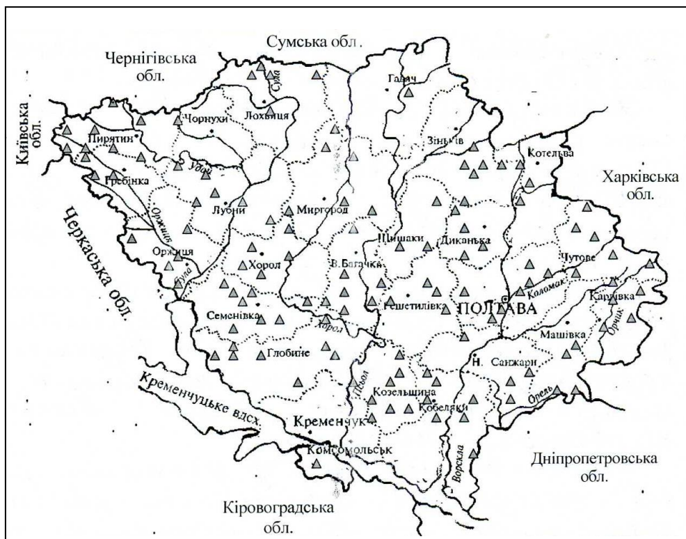
Рис. 7. Поселенське освоєння Полтавщини у XIX-XX ст.