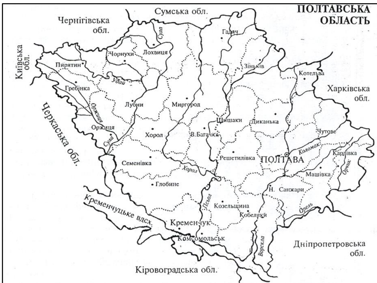
Рис. 2. Полтавська область