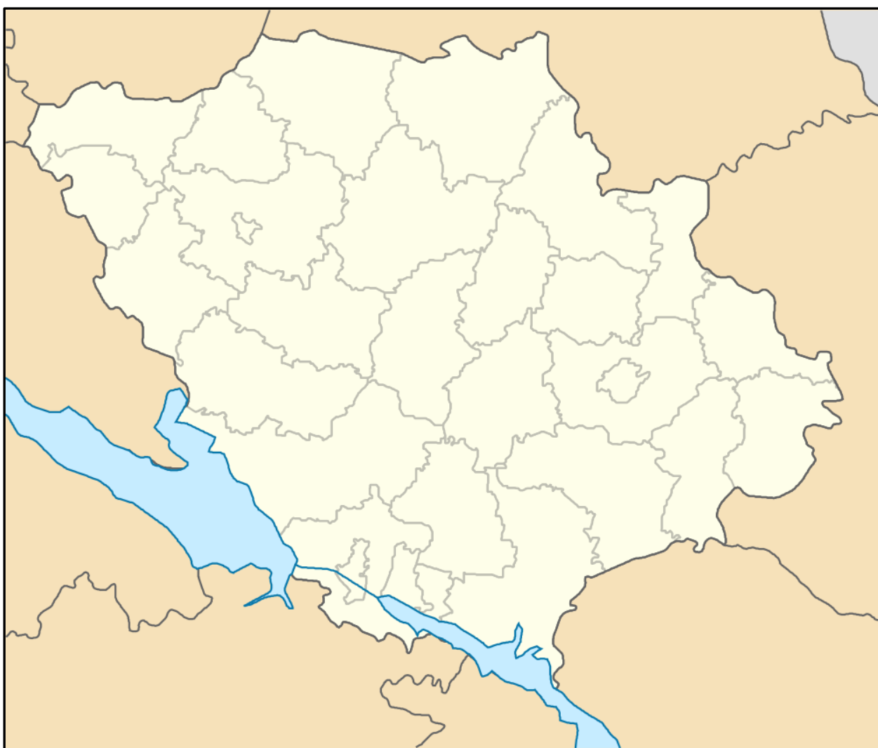
Рис. 1. Контурна карта Полтавської області