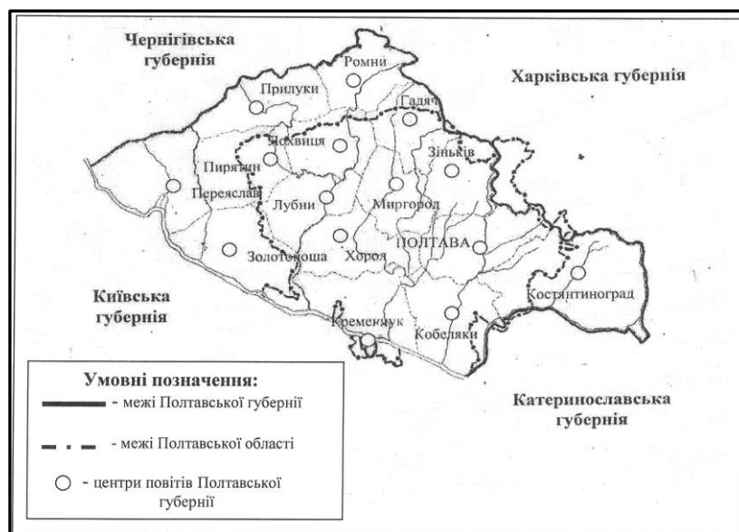
Рис. 3. Порівняльні межі Полтавської губернії та Полтавської області