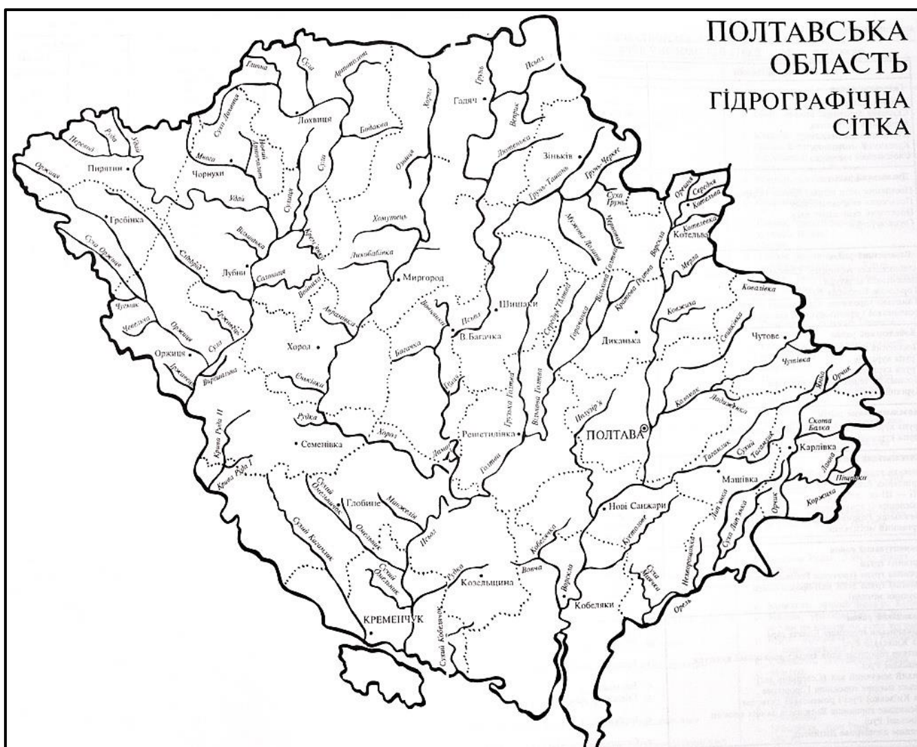
Рис. 8. Гідрографічна сітка Полтавської області