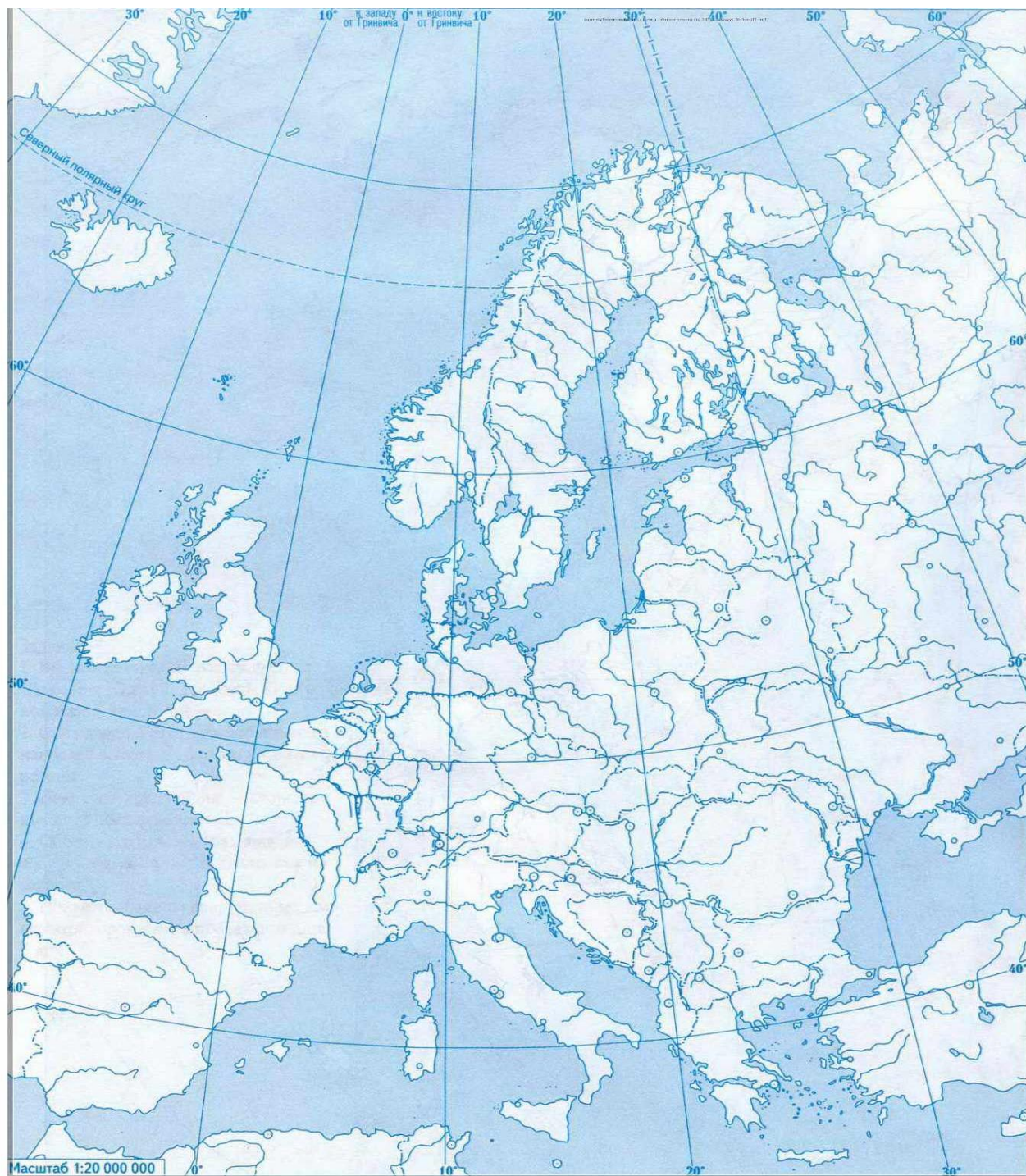
Контурна карта Європи