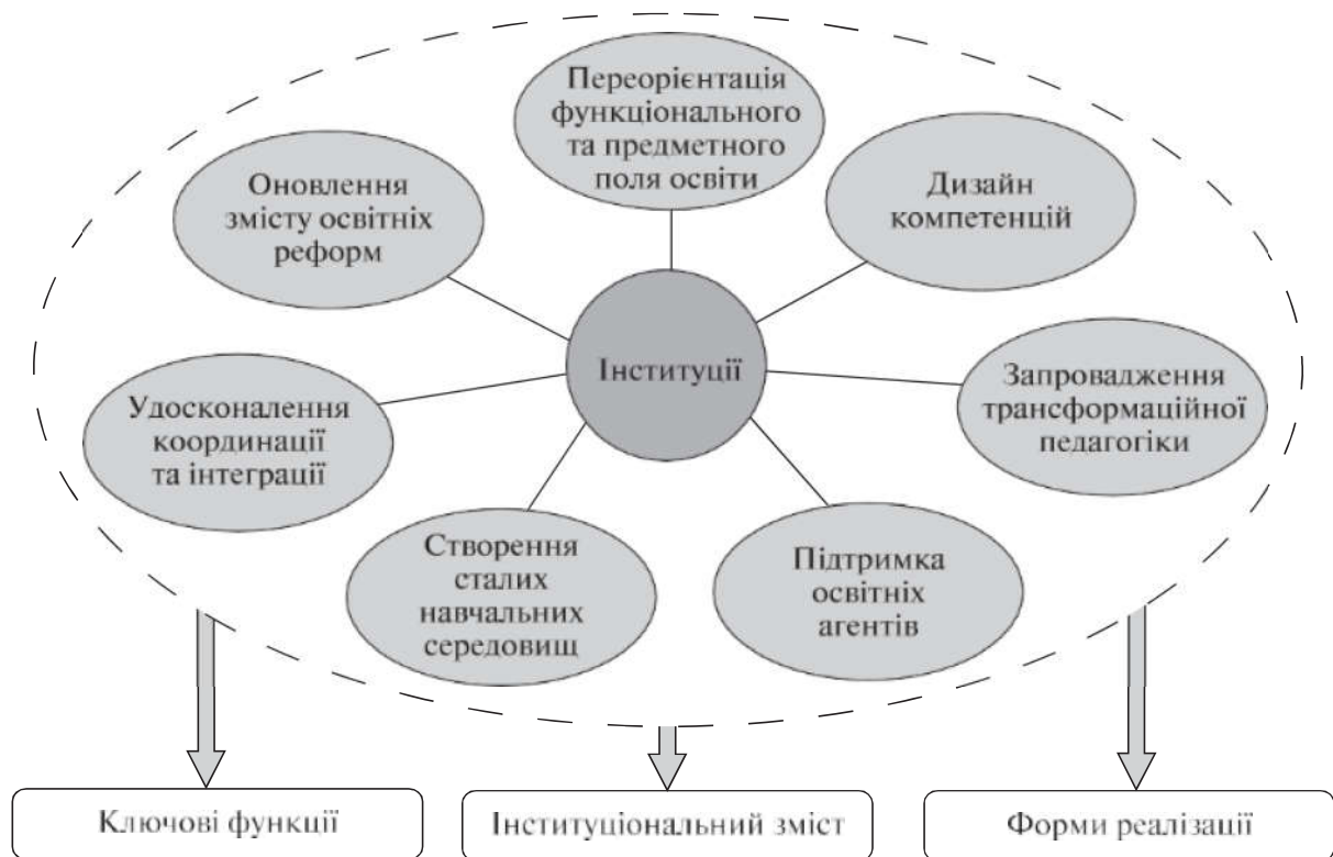
Рис. 3. Інституції у сфері освіти для сталого розвитку (авторська розробка О.М. Хмелевської).

В умовах сьогодення питання безпеки життєдіяльності посідає пріоритетне значення на рівні особистості, колективу, суспільства, держави, світу. Від рівня знань, умінь, навичок, здібностей використовувати їх в необхідний момент залежить не тільки чи зможе людина зберегти себе, врятувати когось зі свого оточення, допомогти сім'ї та суспільству, але й запобігти небезпеці. Зважаючи на це, підготовленість мешканців планети Земля загалом і кожної людини зокрема до безпечної життєдіяльності набуває статусу соціально і педагогічно значущої проблеми. Отже, небезпеки сьогодення нищівно впливають на особистість і групи людей (територіальну, професійну, релігійну тощо), що утворюють соціум. Натомість досвід засвідчує про неспроможність або низьку здатність окремої особистості (як окремої частини суспільства) і колективів впливати на свою безпеку через брак знань, вмінь, особистісних якостей, культури безпечної життєдіяльності та відсутність адекватного підходу до формування культури безпечної життєдіяльності в усіх складових ланках суспільства [11, с.61].