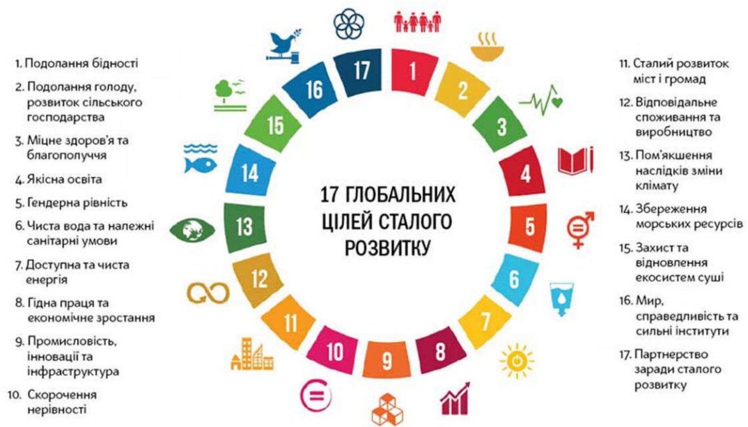
Рис. 2. Глобальні цілі сталого розвитку (ГенАсамблея ООН, 2015)

якості врядування, по-друге, нової якості економічного розвитку, по-третє, нової якості життя [3].