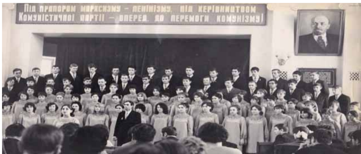
Самодіяльна народна хорова капела Полтавського державного педагогічного інституту імені В. Г. Короленка, 1970 рік

працівників цікавили – лише розмір заробітної плати і відсутність надмірних навантажень.