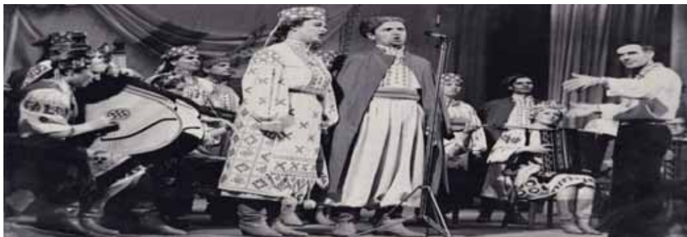
Ансамбль старовинної пісні «Кант»

У 70-х рр. минулого століття при «Горлиці» створено ансамбль старовинної пісні «Кант». Це був унікальний колектив, у якому керівник зібрав кращі жіночі голоси хору та додав чоловічий склад. Виступи ансамблю мали великий успіх і входили до програм звітних концертів «Горлиці». 1981 р. великим ювілейним концертом, присвяченим 20-літтю колективу, жіночий хор «Горлиця» поставив яскраву крапку у власній історії.