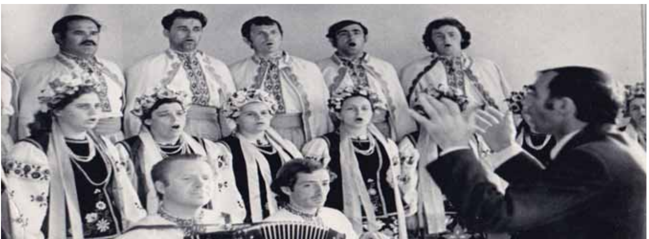
Народний самодіяльний хор «Барвінок» Полтавського м'ясокомбінату

І знову успіх не змусив довго чекати: колектив швидко став багаторазовим переможцем конкурсів і фестивалів та отримав звання «народного». Хор запрошували з концертами в різні міста України, а 1975 р. колектив гастролював у Болгарії. Зоря творчості маестро засяяла з новою силою.