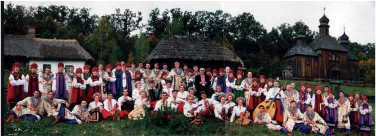
Український народний хор «Калина»

партію (перші та другі скрипки, віолончель, контрабас); партії бандур (першої та другої) і кобз; духових (сопілки, флейти) та ударних інструментів (малого і великого барабанів, тарілки, трикутника, коробки, ксилофона); партії баянів (перших і других) і цимбалів; підготовчої (понад 20) і танцювальної (14 учасників) груп.