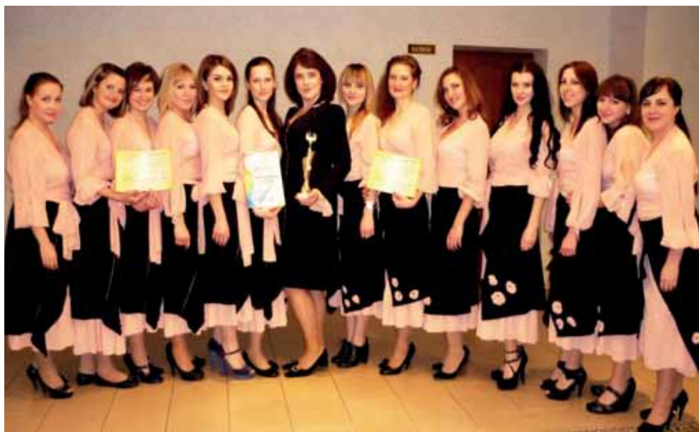
Жіночий вокальний ансамбль «Свічадо» (2012)

сл. А. Гершвіна; твори українських авторів – В. Щепотьєв. Пісні до дитячої п'єси «Хатка в гаю»; муз. І. Кириліної, сл. Л. Гнатюк «Співають діти»; муз. В. Верменича, сл. О. Новицького «Як чудово запахли троянди»; муз. В. Верменича, сл. А. М'ястківського «На калині мене мати колихала»; муз. В. Верменича, сл. А. Каструка «Світанок»; муз. В. Дубравіна, сл. В. Сулова «Ты откуда музыка?»; муз. В. Ільїна, сл. Ю. Рибчинського «Колодязний журавель»; муз. Е. Сокольської, сл. В. Степанової «Даруйте музику»; муз. і сл. О. Житинського «Музика землі»; муз. В. Камінського, сл. Б. Стельмаха «Є на світі казка»; муз. А. Осадчого, сл. А. Дмитрука «Посміхайтесь»; муз. М. Свидюка, сл. М. Бойко «Моя Україно»; муз. В. Литвиненка, сл. М. Бойко «Пісенні крила» та ін.