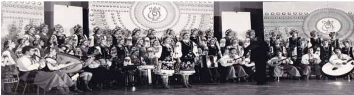
Самодіяльний народний ансамбль «Горлиця»

концертів керівник випускав яскраво оформлені програми, які зберігаються в його багатому домашньому архіві (1965, 1966, 1969, 1971, 1976, 1977) [48].