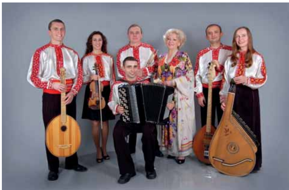
Концертний ансамбль «Чураївна» Полтавської обласної філармонії

У концертному ансамблі «Чураївна» Полтавської обласної філармонії працюють три наші магістри музики.