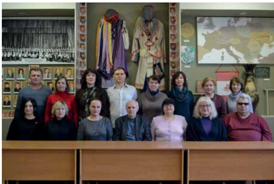
Кафедра музики 2020 р.

додатковою спеціальністю «Музика» (1981–1991); II етап реформування діяльності кафедри музики та употужнення її наукового потенціалу; III – етап ліцензування й акредитації спеціальності «Музика» в умовах входження України в європейський освітній простір.