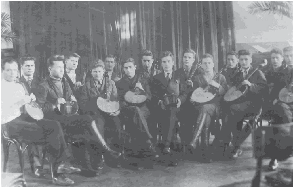
Струнний ансамбль інституту. 1938 р.