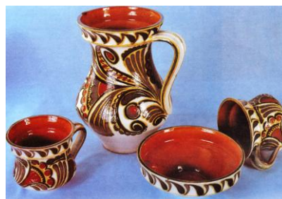
Набір для узвару. Кутя 1980