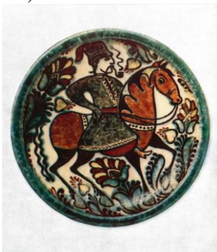
Декоративний таріль. Запорожець 1970

«Багата кутя» (1987), «Хороші гості у мене» (1990); художньо витончених мисок – «Стерня» (1974), «Подих вітру» (1988), «Тепла земля» (1995); мальовничих декоративних тарелей – «Козак від'їжджає» (1978), «Співучий гай» (1981), «Радість буття» (1989).