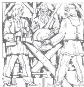
Мої скарби (Теслярі)

Землю рідну бережи, Як малу дитину, Спадок долі обнови