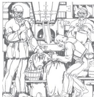
Де мливо й бирова...

Предків пісня тайним звором В буйстві трембітає, І співають гори хором, Скарб – Душа моя – аж сяє!