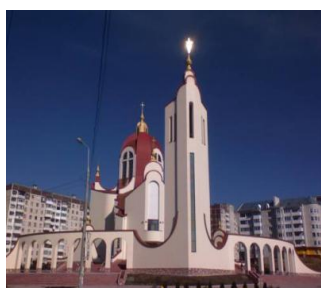
Рис. 1. Церква Петра і Павла (м.Тернопіль, арх. С. Гора)

Отже, сакральні споруди є одним із найбільш масових типів громадських споруд у сучасному будівництві. Через велику перерву у спорудженні церков цей тип споруди фактично не розвивався, тому сучасні архітектори змушені відроджувати і по-новому «винаходити» принципи храмового будівництва. Невичерпним та єдиним джерелом для актуальної творчості є історична спадщина. Основними архітектурними періодами для наслідування в українській сакральній архітектурі сьогодні є наступні: період Київської Русі, доба бароко та кінець ХІХ - перша третина ХХ ст., дерев'яні церкви карпатського регіону ХІХ -ХХ ст.