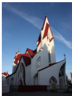
Рис. 2. Костел Божого Милосердя і Матері Божої Неустанної Помочі (м. Тернопіль, арх. І. Чулій)