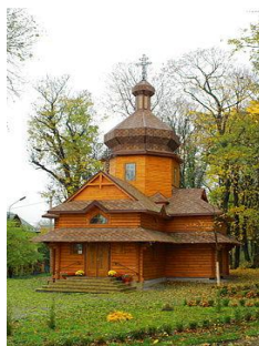
Рис. 3. Церква Зарваницької Матері Божої (м. Тернопіль, арх. М. Нетриб'як)