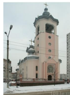
Рис. 4. Церква Зарваницької св. Йосафата (м.Тернопіль, арх. О.Головчак)