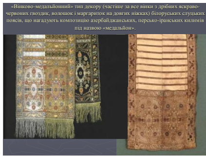
«Вінково-медальйоний» тип декору (частіше за все вінки з дрібних ясно-червоних гвоздик, волошок і маргариток на довгих ніжках) білоруських случьких поясів, що нагадують композиційно азербайджанських, персько-іранських килимів під назвою «медальйон».