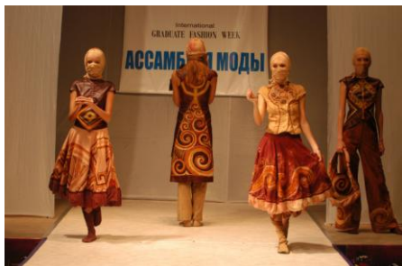
Рис. 1. Колекція моделей одягу «Міфи Трипільського світу»

оздоблення, характер орнаментальних мотивів, конструкцію тощо. Крім того, студент повинен визначити, за рахунок яких застосованих засобів зв'язку (ритм, симетрія, асиметрія, тотожність, нюанс, контраст тощо) досягається враження руху чи рівноваги, виразності чи підпорядкованості, кількості чи розвитку, смислового фактору чи образності головного або другорядних композиційних елементів як складових первинної форми джерела творчості, а також знати і розуміти, як працюють закони композиції.