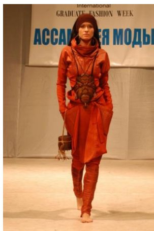
Рис. 2. Модель з колекції моделей одягу «Відлуння аборигенів»