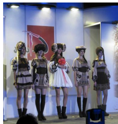
Рис. 3. Колекція моделей одягу «Етнохвиля»

Аналіз спеціальної літератури з основ композиції показав, що сьогодні не існує стрункої, логічної системи композиційних понять та чинників, що впливають на кінцевий результат досягнення композиційної гармонії в об'єктах дизайну. Студенту важко самостійно розібратись в хаосі часто суперечливої інформації, особливо щодо термінологічної лексики, яка надається різними авторами в навчальній та науковій літературі. Тому на кафедрі дизайну ХНУ на основі вивчення принципів формоутворення в природі було розроблено схему створення композиційної гармонії для об'єктів дизайну.