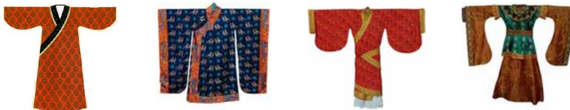
Рис. 1. Чоловічі та жіночі форми китайського народного костюма

За матеріалами досліджень були виділені характерні форми китайського народного костюма. В роботі представлено чотири найбільш характерних історичних костюма, які в подальшому використовувалися, як прототипи для формування принципів проектування майбутньої колекції форменого одягу.