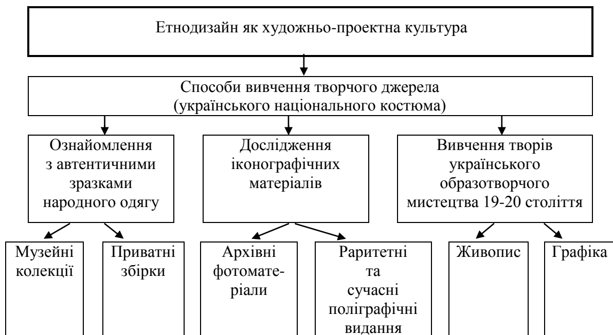
Мал. 1. Етапи вивчення творчого джерела

Художньо-проектна етнодизайнерська культура сьогодення базується на традиційних способах вивчення національного народного костюма, а саме: ознайомлення з автентичними зразками народного одягу, дослідження іконографічних матеріалів, вивчення творів образотворчого мистецтва [3].