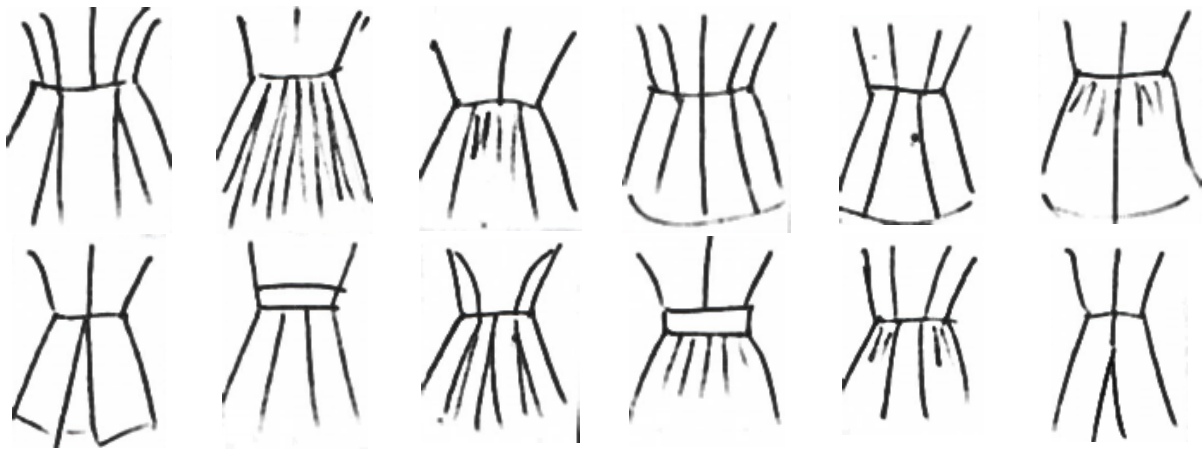
Мал. 6. Варіанти крою спинки пальто

Ефективною складовою підготовки дизайнерів в Київському національному університеті технологій та дизайну в галузі художнього моделювання костюма, важливим чинником розвитку їх творчих здібностей є творчі навчальні проекти. Метою творчої проектної діяльності є сучасний проект, від ідеї та її розробки до реального втілення у матеріалі, з використанням знакових елементів національного костюма. Творча проектна діяльність формує високу мотивацію до дослідження національної культури і прагнення до самовдосконалення, дозволяє досягти результативності та естетичної довершеності об'єктів проектування.