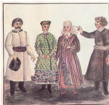
Мал. 4. Мешканці м.Обухів та с.Білогородка Київського повіту