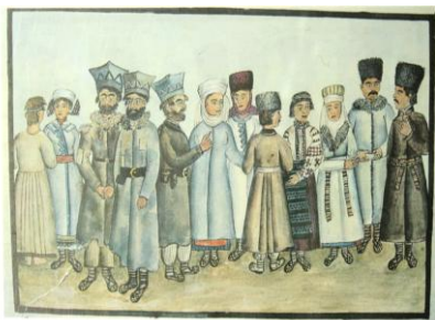
Діти з с.Віжача, с.Звенигород, Червоноград, Рівненський, Максимовичі, Шершні, Слобода, Рожів та Колінці Радомишльського повіту.

творчих замальовок і записів та їх аналіз.