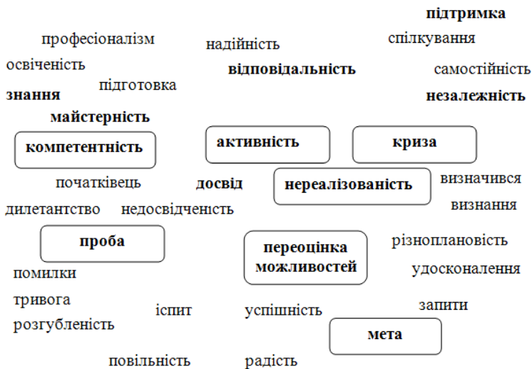
Рис. 2. Семантичний простір асоціацій, що відображають структуру професійної ідентичності студентів, які здобувають другу вищу освіту (семантичне поле включає асоціації, підтримані більше ніж 30 % опитаних, жирним шрифтом виділені ті, що отримали більше 50 % виборів)

Професійна ідентичність як аспект соціальної ідентичності представляє собою суб'єктивну реальність (Я-концепцію, Я-образ), що відображає належність до певної професійної групи, регулює поведінку особистості, її сприймання світу й оточення. Проведений семантичний аналіз асоціацій дозволяє уточнити сутнісний зміст кризи особистісно-професійного розвитку та шляхів її вирішення. Переживання кризи окреслене змістом понять «нереалізованість», «переоцінка своїх можливостей», «активність», «проба», «мета», та «компетентність». Значущість категорії «досвід» розкриває роль власної активності у життєздійсненні: перенавчання постає як певний шлях до вдосконалення, сповнений проб та помилок.