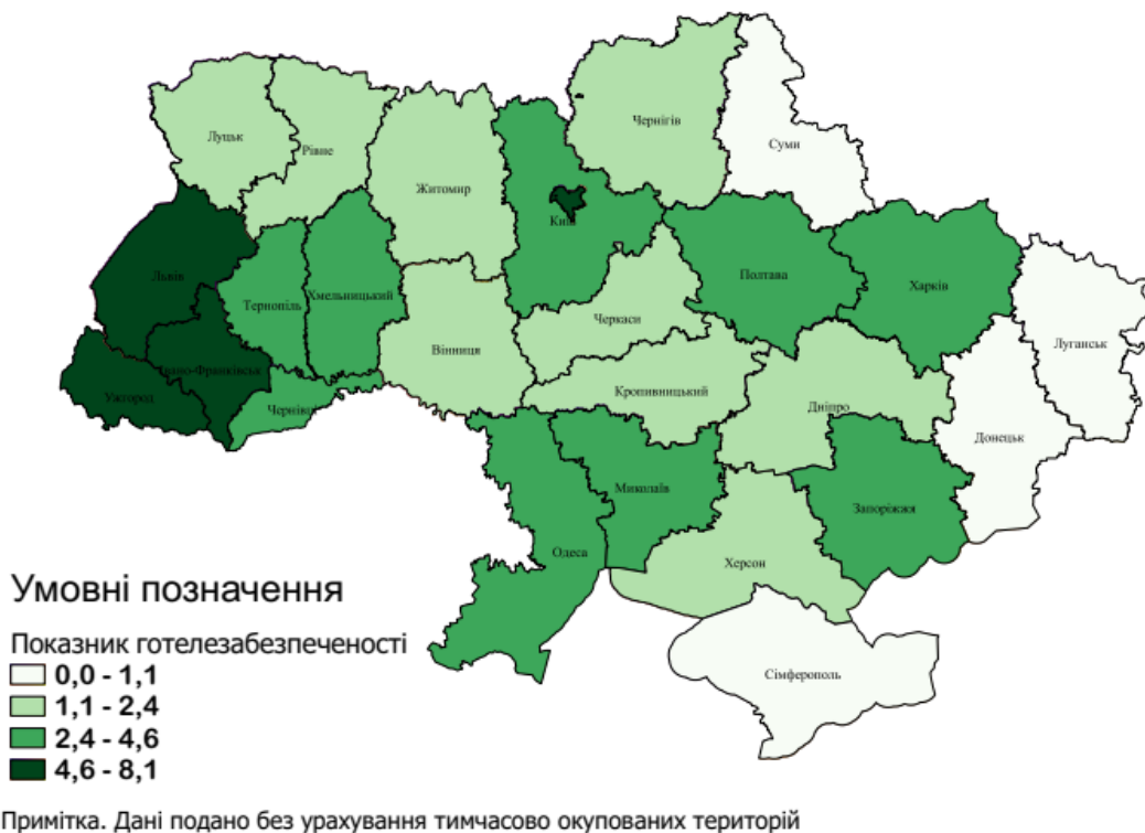
Рис.2. Готелезабезпеченість областей України (станом на 2017 р.)

Найбільші показники, вище 7 місць на 1000 осіб мають Закарпатська (8,08), Івано-Франківська (8,03) та Львівська (7,22) області. Проте і ці цифри нижче норми. Найгірша ситуація в Донецькій та Луганській областях, де показник на рівні 0,6. Все це перешкоджає розвитку готельного господарства, входженню на вітчизняний ринок відомих готельних операторів та створенню