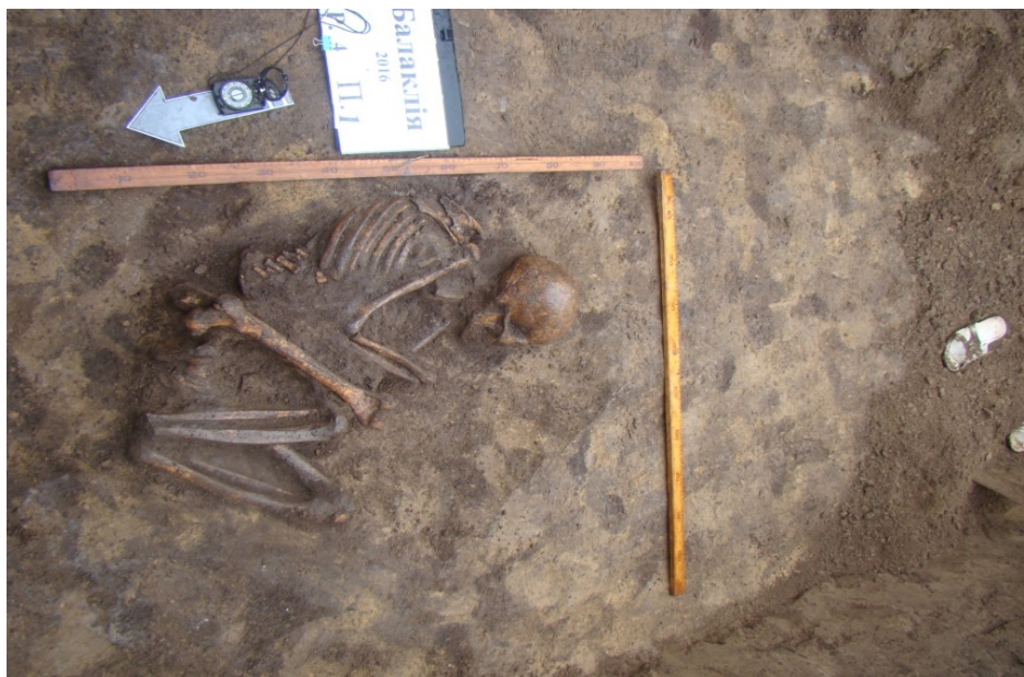
Мал. 2. Балаклія. Розкоп 4. Поховання 1

Поховання 1 (бережнівсько-маївської зрубної культури) (мал. 2, 3). Виявлене у північній ділянці розкопу, на рівні перед материка, за 0,25 м на південь та 0,5 м на схід від північно-західного кута (реперу) розкопу. Пляма вирізнялася чорно-коричневим заповненням на тлі перед материка (мал. 2,3). Розміри плями 1,0x0,6 м. Яма поховання округлої форми. Розміри по верхньому краю 1,1x0,6 м, по дну 0,8x0,5 м заглиблена у материк на 0,2 м.