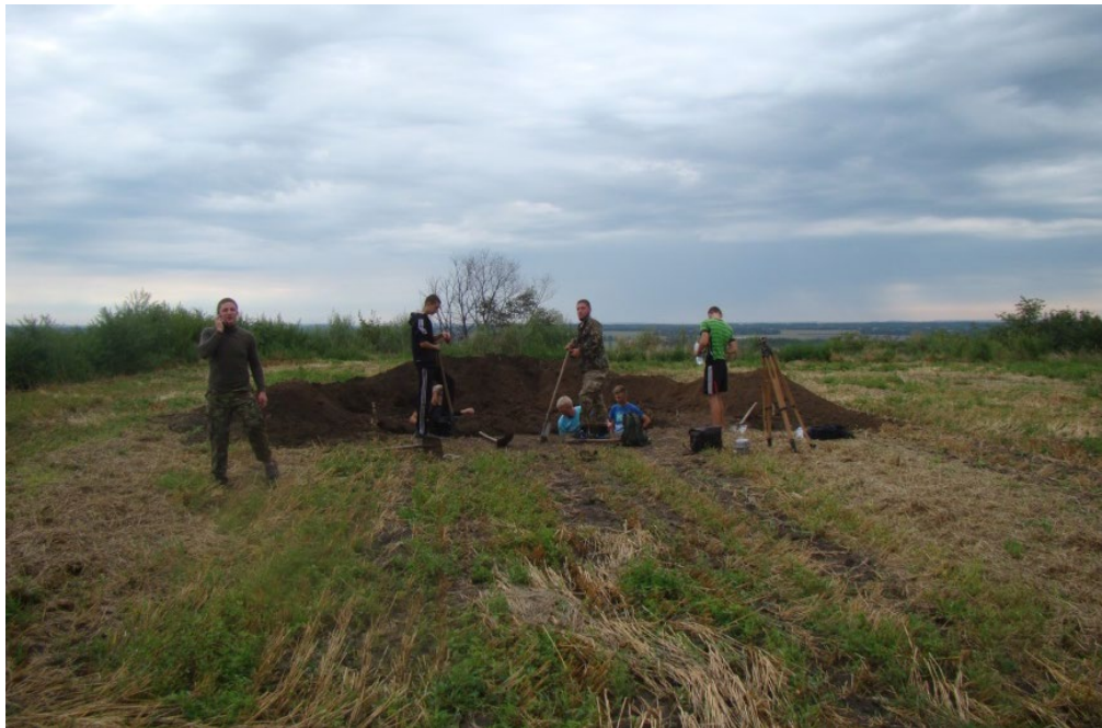
Мал. 1. Балаклія. Розкоп 4. Робочий момент.

У 2016 р. археологічна експедиція Полтавського національного педагогічного університету ім. В.Г.Короленка та Полтавського краєзнавчого музею ім. В.Г.Кричевського провела дослідження на найменш археологічно вивченому городищі ранньомодерного часу, розташованого в с. Балаклія Великобагачанського району Полтавської області [1-3]. Балаклія (Бакля, Баклей) – сотенне містечко Полтавського полку у 1648-1661 рр., Розташоване на південно-східній околиці села, на відрозі правого берега р. Псел. Розкоп 4 розміщений у центральній частині містечка, але закладений північніше та східніше від розкопу 1, на ділянці місцевості, що вище за рельєфом, край схилу, за 24 м на схід від нього (мал. 1). Місцевість має незначний ухил в південному напрямку. Розміри 4×2 м. Орієнтований по лінії північ-південь. Р – північно-західний кут. Ділянка розорюється, окрім того нині, вона є приватною власністю для ведення сільського господарства, тому проведення повномасштабних досліджень залишків кургану є проблематичним.