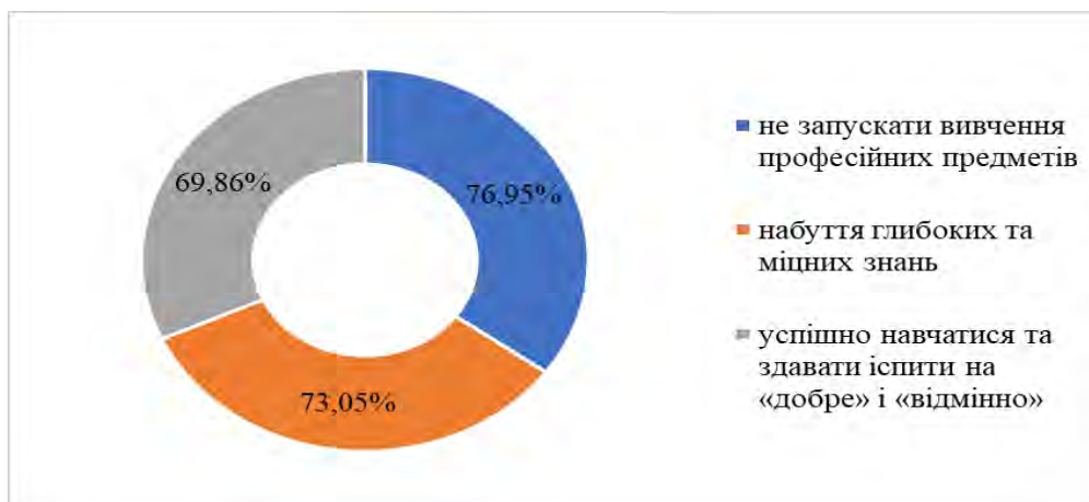
Рис. 2 Найбільш значущі мотиви для майбутніх психологів у навчанні

Аналіз результатів, отриманих за методикою «Вивчення мотивів освітньої діяльності здобувачів освіти» (А. Реан, В. Якунін) графічно зображено на рис.3.