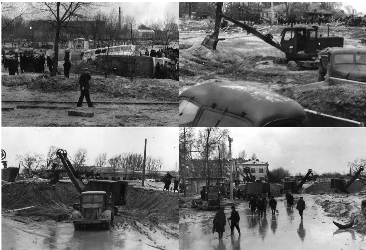
Рис. 5. Аварійно-рятувальні роботи на вулиці Фрунзе

Роботи з очищення територій від винесеного розрідженого ґрунту розпочалися одразу після трагедії (рис. 5). Зону лиха огородили, зруйновані будинки та адміністративно-господарські приміщення розбирались, вивозився бруд, ремонтувався тротуар і т.д. Як робочу силу використовували військовослужбовців Київського гарнізону та внутрішніх військ МВС, пожежників, міліцію, будівельні організації, громадськість столиці (рис. 6).