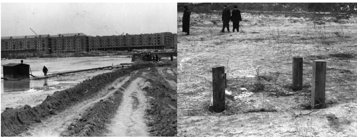
Рис. 4. Намив Бабиного яру та відведення технологічної води

Було встановлено, що при складуванні відходів Петровських цегельних заводів у Бабиному яру відбулися суттєві відхилення від планових завдань. Зокрема, водовідводний колодязь у третьому від'ярку мав одну трубу діаметром 450 мм замість двох такого ж діаметру, сам колодязь був у занедбаному стані, напередодні аварії намів проводився 16 годин замість 8 передбачених, тоді як останні 4-5 днів вода з наміву не відкачувалась узагалі (рис. 4). Не повною мірою ураховувалися гранулометричний склад ґрунтів, складованих у від'ярки, їх довготривала консолідація. З поля зору проектувальників випала важлива деталь – наявність підземних вод у районі третього від'ярку, що робили питання водовідведення надзвичайно важливим. Сукупність цих факторів за умови недогляду виконавців і призвела до перенасичення намітої в яр пульпи водою, яка, розмивши нижню дамбу, легко привела в рух інші наміти ґрунти, що не встигли як слід ущільнитися.