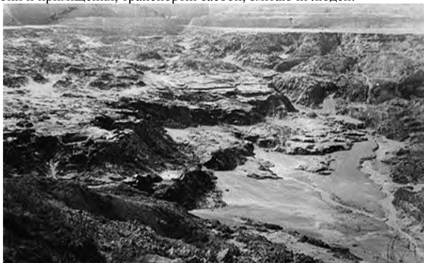
Рис. 3. Прорив дамби і сходження лавини

Фатальним для мешканців та працівників мікрорайону Куренівка Подільського району Києва став ранок понеділка 13 березня 1961 р., коли близько 650 тис. кубометрів намивної маси – відходів цегельних заводів – подібно лавині зійшли з Бабиного яру на житловий масив, виробничі приміщення і трамвайне депо ім. Красіна (рис.3). Передані очевидцями подробиці приголомшують блискавичністю сходження пульпи та безпорадністю тих, хто в той трагічний ранок опинився у смертельній зоні: восьми-десятиметрова лавина зі швидкістю 3-5 м/с за півгодини накрила площу понад 30 га, безперешкодно руйнуючи на своєму шляху житлові споруди, виробничі приміщення, транспортні засоби, змітаючи людей.