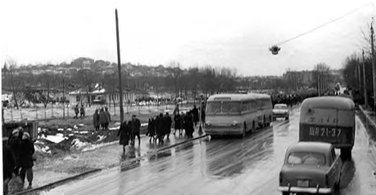
Рис. 7. Відновлення руху громадського транспорту на вулиці Фрунзе

Офіційне «Повідомлення Урядової комісії про закінчення розслідування причин аварії намитих земляних мас у Бабиному Яру і заходи по ліквідації наслідків затоплення і руйнувань в районі Куренівки м. Києва» було оприлюднене лише 31 березня 1961 р. Це було перше й останнє актуальне повідомлення в друкованих ЗМІ про катастрофу. Офіційна версія визнавала помилки проекту наміву і порушення технології виконання робіт, що призвели до великого насичення водою нижніх шарів наміву і зосередження значної кількості води у верхів'ях яру, прориву дамби. У результаті аварії, підсумовувала спеціальна урядова комісія, «зруйновано або серйозно пошкоджено 22 приватних одноповерхових дерев'яних будинки, 5 двоповерхових і 12 одноповерхових дерев'яних будинків державного житлового фонду і два одноповерхових гуртожитки барачного типу», що навіть непосвяченим людям вказує на значні масштаби руйнувань. Згідно офіційного повідомлення жертвами аварії стали 145 осіб, «загальна матеріальна шкода від затоплення і руйнувань» оцінювались у розмірі 3,7 млн рублів.