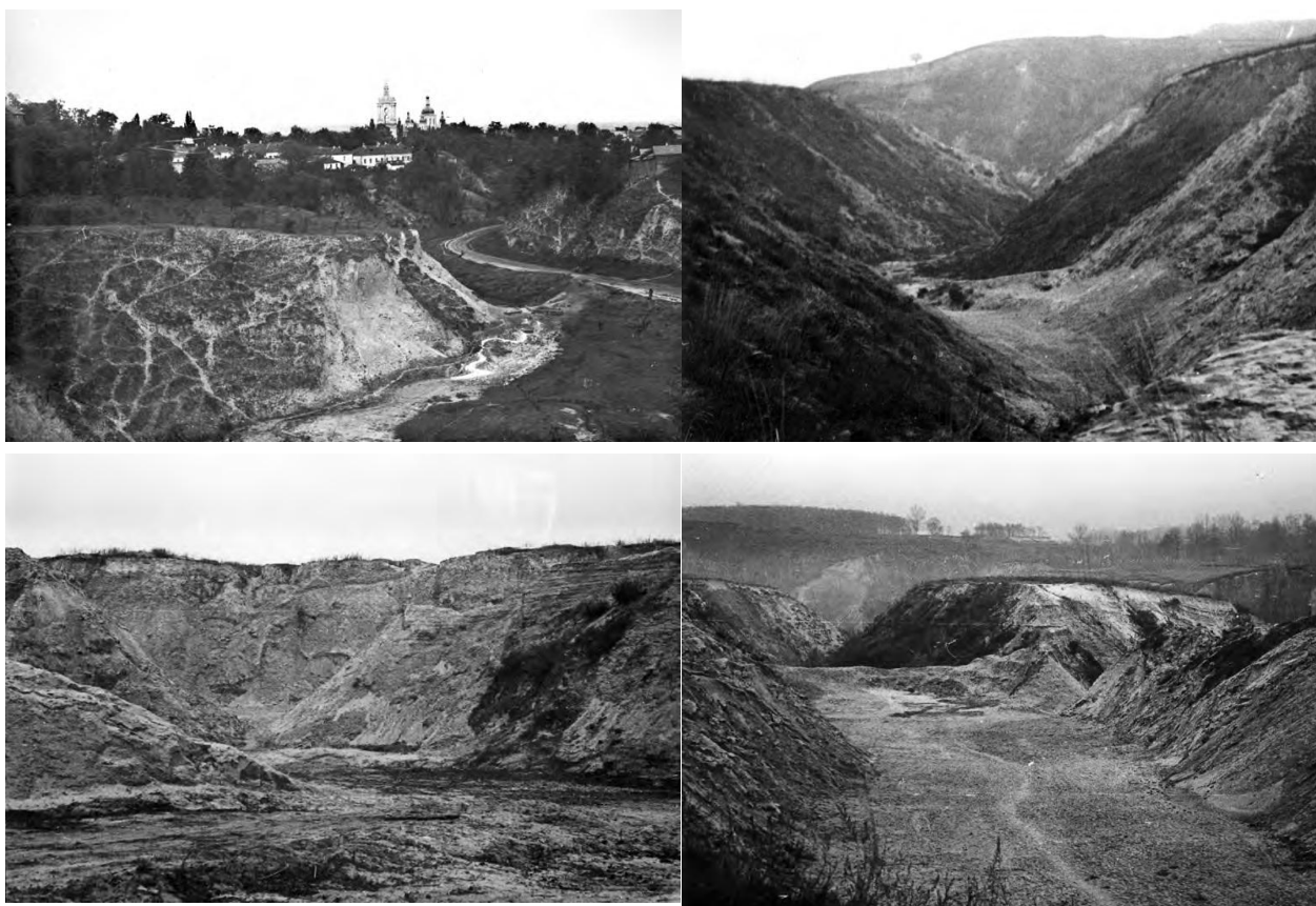
Рис. 1. Ділянка Бабиного Яру в 40-х роках ХХ століття

У свій час існували різні плани облаштування Бабиного яру, але у першій половині ХХ століття він зберігав свої обриси [1]. Проекти з будівництва доріг тут реалізовані не були. У 1950 р. постало питання звільнення кар'єрів Петровських цегельних заводів від невикористаних земляних порід. Розглядалися два варіанти – скидання їх у заплаву р. Дніпро та складування у від'ярки Бабиного яру. Останній являв собою рівчак довжиною 2,5 км й глибиною від 10 до 50 м (рис. 1). З огляду на економічну вигідність, більшу технологічну доступність Міністерство промисловості будівельних матеріалів УРСР схилилося до другого варіанту.