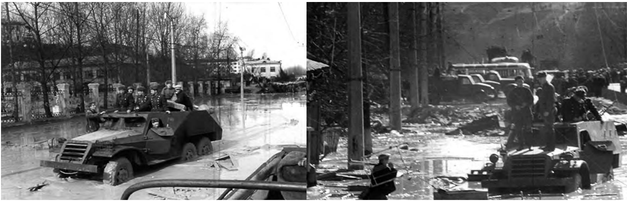
Рис. 6. Участь військовослужбовців у рятувальних роботах