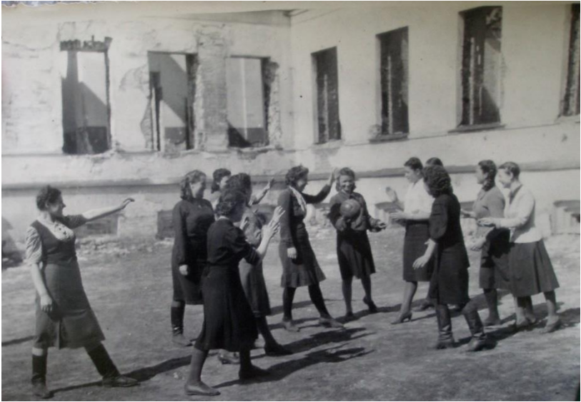
Студентки повоєнних років у дворі напівзруйнованої будівлі по вул. Сковороди, 14.