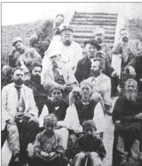
Видатні митці України на могилі Т. Г. Шевченка. 16.07.1892 р.