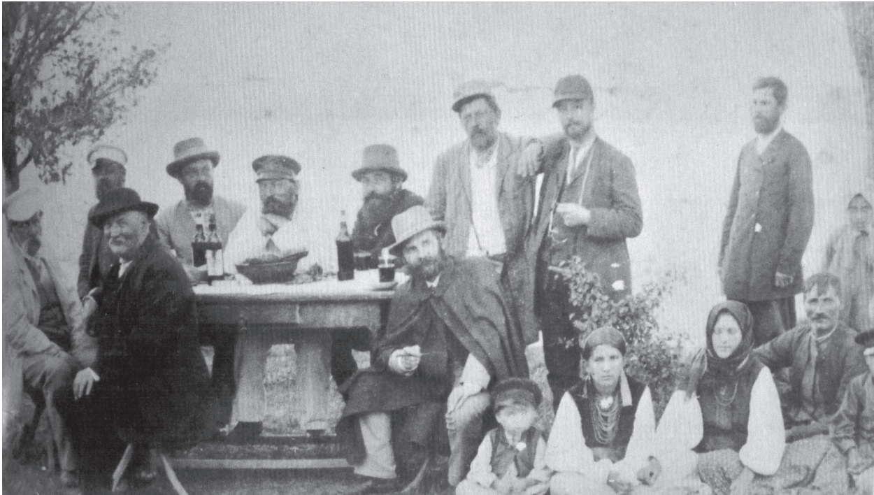
Групове фото біля могили Т. Шевченка. 16.07.1892 р.

Тож і 1892 року вони не порушили традицію: віншували іменинника з 40-річчям. Очевидно, 15-го липня всі разом були в Прохорівці,