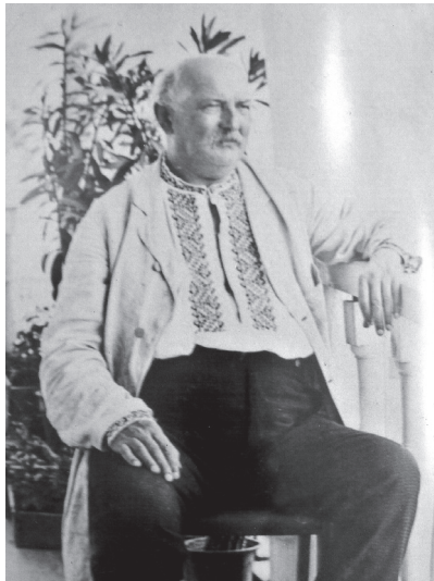
В. С. Гнилоширов (1836–1900), педагог, просвітник, багаторічний охоронець Шевченкової могили в Каневі