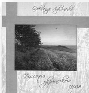
Філософія українського серця: Поетичні роздуми. Полтава, 2010. 120 с.