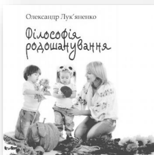
Філософія Родошанування. Поетичні роздуми. Полтава, 2015. 383 с.