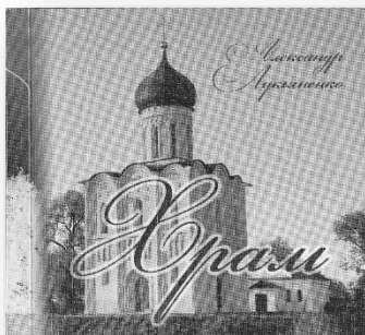
Храм: Філософія серця. Полтава, 2011. 116 с.