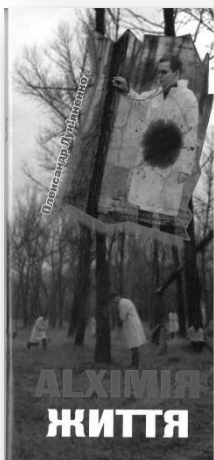
Алхімія життя: драма-викриття. Полтава, 2012. 96 с.