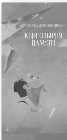
Книгозбірня пам'яті: Сто спогадів одного кохання. Поетична сповідь. - Полтава, 2017. - 112 с.