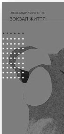
Вокзал життя: Сто роздумів на перехресті. Поетичні мандри. - Полтава, 2018. - 112 с.