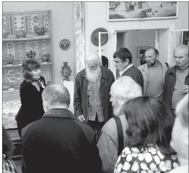
У Пархомівському історико-художньому музеї

– Я не є хворобливо амбітною людиною. І не беруся зараз визначати, чи то є добре, чи погано. Мене з дитинства зачарувувала краса