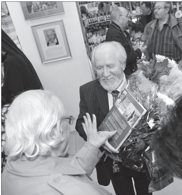
Відкриття ювілейної персональної виставки в Художньому салоні м. Полтави. Жовтень 2011 р.

лат, що ми – “парость” від природи, а отже, будь-який замах на неї – це дамоклів меч над нами. Людство, засліплене жагою вдоволення матеріальних потреб, вишукуванням зруч-