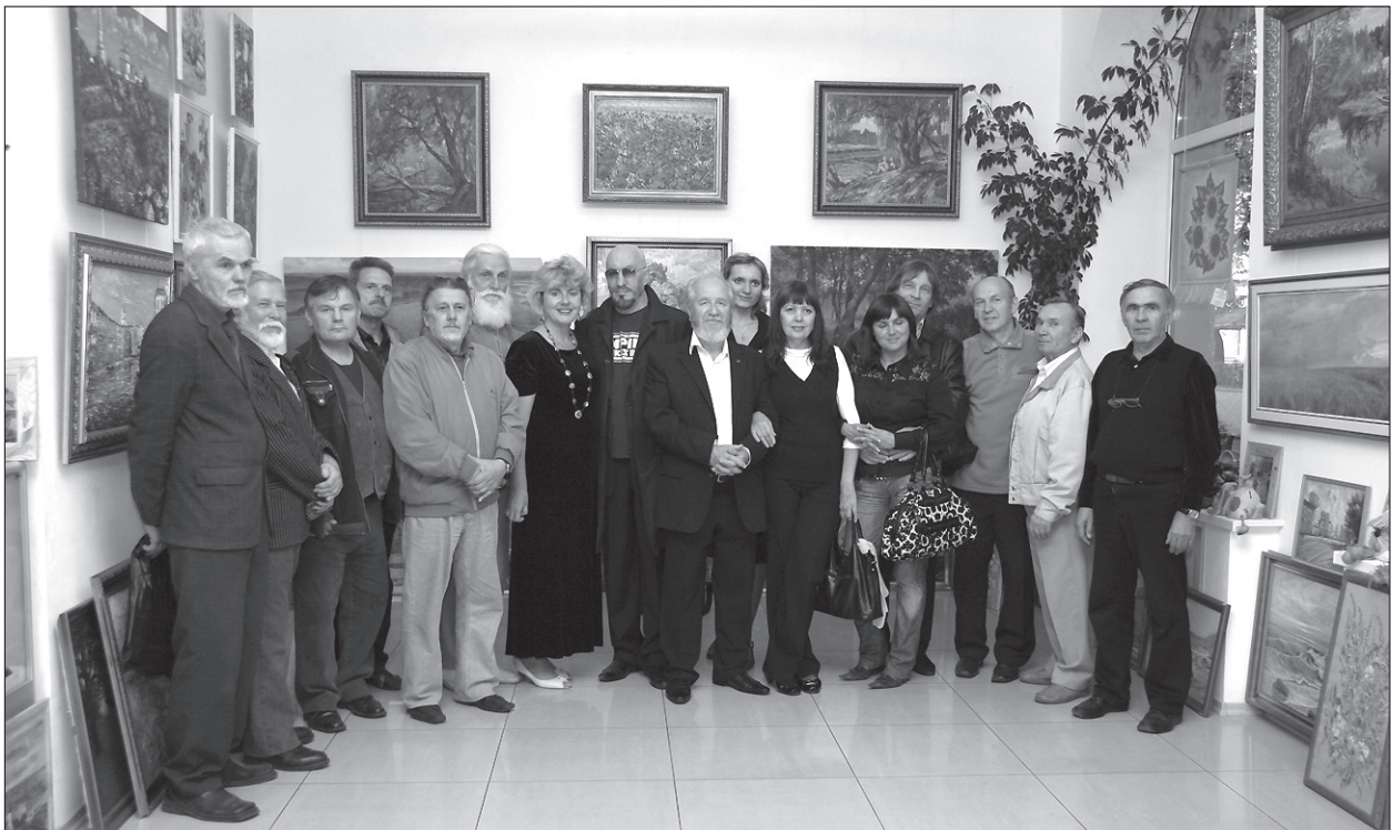
Із колегами-митцями, членами Полтавської обласної організації Національної спілки художників України

– Знаю, що планувалося видати альбом, у якому розкривалася б історія Полтавської обласної організації Національної спілки художників України. Чи ведеться над ним робота?