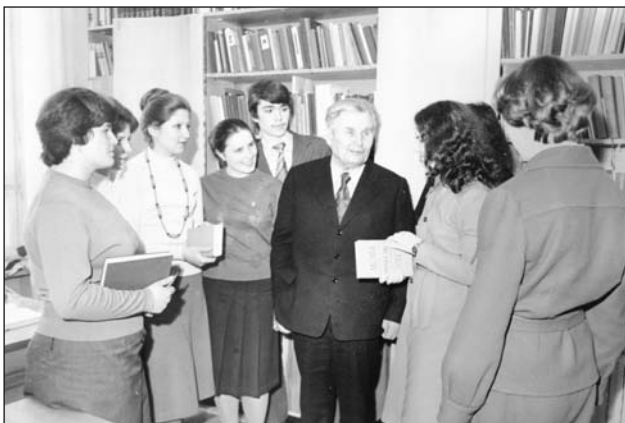
Зустріч М. А. Жовтобрюха зі студентами-філологами біля власного фонду в бібліотеці Полтавського державного педагогічного інституту імені В. Г. Короленка. Фото, м. Полтава, 1980 р.

завідувачка відділу комплектування, наукового опрацювання документів та зберігання фондів. У вступному слові до видання, про яке йдеться, наголошено, що Михайло Жовтобрюх – «учений-славіст світового рівня, який опублікував понад 300 праць, талановитий педагог, який велику частину свого життя присвятив викладацькій роботі, уміло й впевнено вів майбутніх учителів-філологів у чарівний світ рідного слова, усеяв у їхні душі любов і пошану до рідної мови, до славного минулого нашої України, вихователь наукової молоді, який підготував 25 докторів і кандидатів філологічних наук, благословив багатьох дослідників-мовознавців на славі наукові звершення» [3, с. 7].