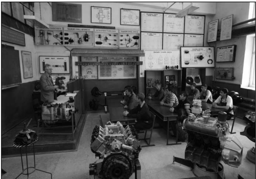
Заняття в автокласі