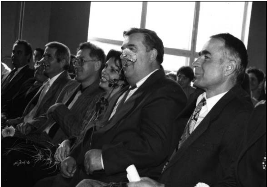
Урочисте засідання з нагоди 20-річчя факультету