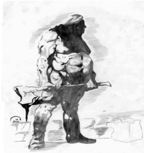
Рис 4. «Я серед людей»

Автор малюнку зобразила себе у образі воїна-одинака який готовий до бою. Автор стверджує, що таку готовність він відчував усе життя і будь-яку агресію з боку оточення він мужньо долав, хоча й залишався самотнім. Психологічний аналіз малюнка дозволив стверджувати, що протагоніст з дитинства був жертвою нападів батька. За словами автора, батько виступав катом щодо нього, що виявлялося в підвищеному контролі його дій, поглядів на життя. Автор зазначає, що усіма своїми соціальними досягненнями він зобов'язаний батькові, який навчив його «прозі» життя, створивши пекельне дитинство. Дитинство, за словами автора, навчило його виживати в агресивному світі. Завантаженість базальною тривогою заважає автору бачити індивідуальність оточуючих його людей у зв'язку з очікуванням небезпеки, а недовіра до доброти інших людей породжує тривожність, готовність до агресивності.