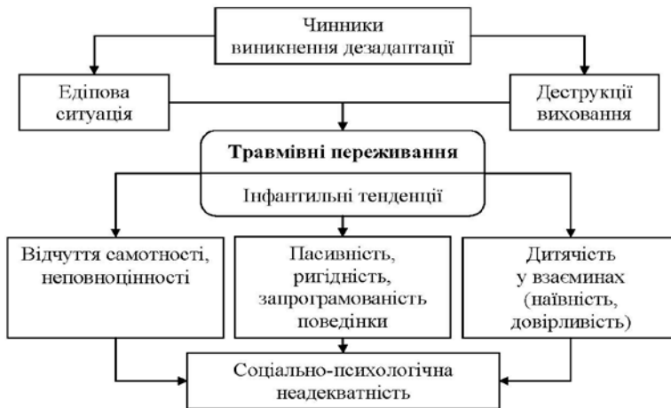
Рис. 5. Схема «Чинники виникнення дезадаптації суб'єкта»

Таким чином, на основі аналізу емпіричного матеріалу та теоретичних джерел представлено схему впливу травмівних переживань дитинства на дезадаптацію суб'єкта (рис. 5).