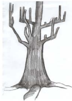
Рис. 2. «Я в сім'ї батьків»

На рис. 2 зображено засохле дерево та осінь, що символізує образу автора на батька. Протагоніст стверджує, що боялася його покарань до смерті та ладна була вмерти, аби не залишатися з батьком наодинці.