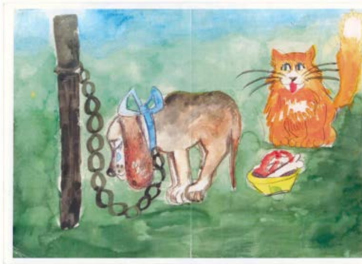
Рис 3. Собака на ланцюзі й кішка (неавторський малюнок)