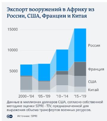
Рис. 1. Інфографіка обсягу експорту озброєнь в Африку з Росії, США, Франції та Китаю.

Фокус російської дипломатії в останнє десятиліття зосередився на Чорному континенті через низку причин. Москва звернула увагу на Африку як на багатий ресурсами регіон, вплив на який може компенсувати недолік фінансових та інших ресурсів у суперництві Росії із Заходом. Йдеться, зокрема, про видобуток в африканських країнах корисних копалин і постачання туди російської зброї (Рис. 1).