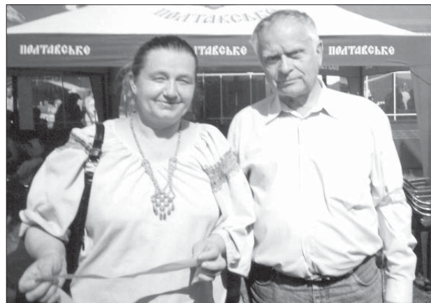
Із поетом і політиком Д. Павличком – на Сорочинському ярмарку. 21 серпня 2004 р.

Шукати іншого місця під сонцем змусило раптове і гостре відчуття “гніту”: займаєшся начеб не тим, хочеш інших горизонтів, широт, жадаєш росту і творчості! Не в кожного старчить волі піти з насидженого кабінету на