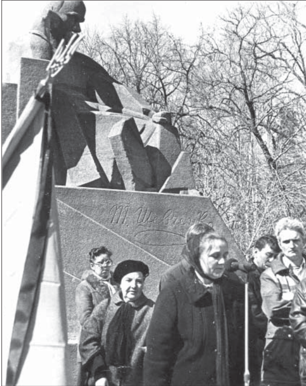
Бурхливі 1990-ті... Зі словом Кобзаря – в боротьбі за українську свободу