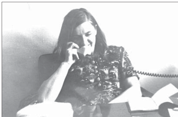
У редакції газети. Дзвінок від судженого з Чернігова