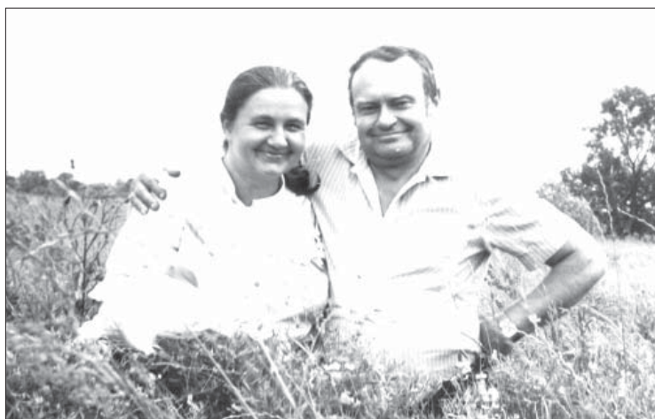
У прудеснянських лугах, с. Карпилівка, 1990 р.

Зателефонував, почув, що йому раді (що його, може, навіть чекають!), попросив