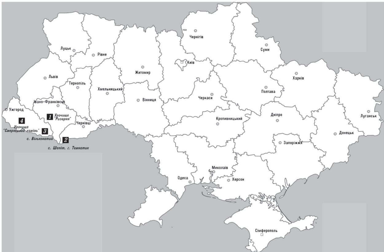
Рис.1. Карта-схема поширення Pseudohygrohypnum fertile на території України