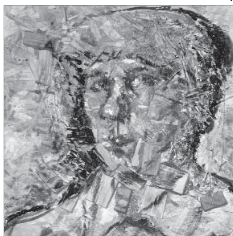
Григорій Вовк. Автопортрет екслюзі. ДСП, дерево, олія, 40x39,5. 2011

Григорій Петрович Вовк народився 13 липня 1954 р. у мальовничому передмісті Полтави. Від самого дитинства мріяв стати художником: “...малюю, скільки себе пам’ятаю, – пригадує, – коли був малим, малював чорнильним олівцем – інших у моєму дитинстві не було. Мама зберегла малюнки з мого дитинства. Тепер вони зі мною” [7]. У родині полтавців Вовків ніхто не малював так гарно, як дядько, на честь