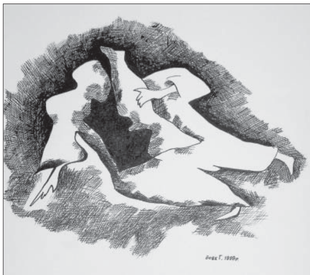
Григорій Вовк. Бездушна людина. Папір, туш, 27х21. 1998

вулицею, розглядаю ті предмети, які мене зворушують, запам'ятовую для того, щоб, переробивши ті відчуття, які виникли на образах, які я бачив, створити новий образ. Я б хотів нестандартними методами передавати те, що бачу, бо люди звикли дивитися весь час на однаковий, звичний світ” [7].