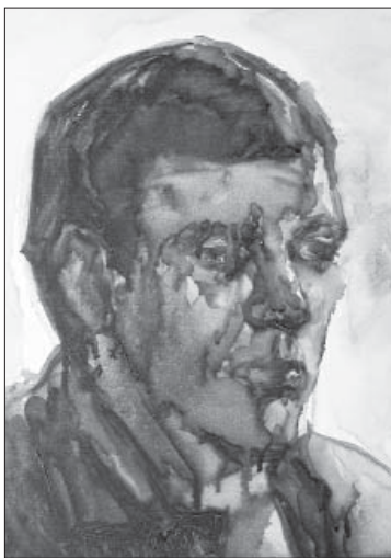
Григорій Вовк. Автопортрет. Олія, картон, 34,3x25. 1976

Токіо); 1999 р. – “Творче дихання”, персональна (Одеський художній музей); 2001 р. – “Графіка”, міжнародна (Санкт-Петербург); 2005 р. – “Одеські художники”, міжнародна (Прага); 2006 р. – “Одеса в акварелі” (Музей західного та східного мистецтва, Одеса); 2007 р. – “Голодомор” (Всеукраїнське т-во Просвіта, Одеса); 2009 р. – “Високий замок”, міжнародна (Львів); 2010 р. – “Одинокий авангард”, персональна (Музей сучасного мистецтва Одеси); 2011 р. – “Про світ, про людей, про себе”, персональна (“Община прогресивного іудаїзму”, Одеса); 2011 р. – “Біблійні мотиви”, персональна; 2012 р. – “Емоції кольору” (Музей образотворчих мистецтв імені О. Білого, Іллічівськ). Це далеко не повний перелік експозицій, та однією з найбільш пам'ятних був “Фестиваль авангардного мистецтва” в Ризі (1988), як пригадує сам художник. За оцінкою Міжнародного художнього рейтингу Григорія Вовка зараховано до категорії “професійний художник, становлення якого відбулося і який відповідає потребам художнього ринку”.