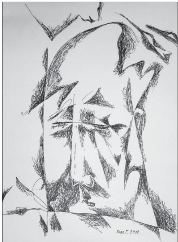
Григорій Вовк. Пророк у задумі. Паніф, гелева ручка, 28,5x20. 2012