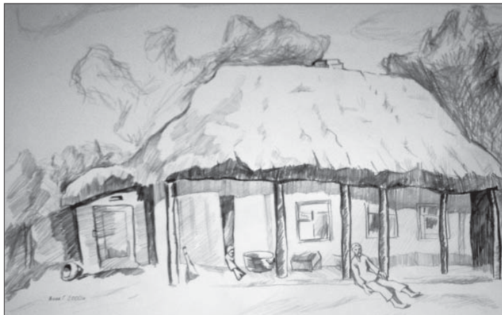
Григорій Вовк. Голодомор у Полтавській області. Папір, олівець, 28x40. 2000

це і реалістичні сюжети – “Коти” (2008); “Осінь у Лузанівці” (2001), “Море. Крижанівка” (2005), “Оперний театр” (2001), й експресивні портретні образки – “Мрії” (2008), “Динаміка” (2009),