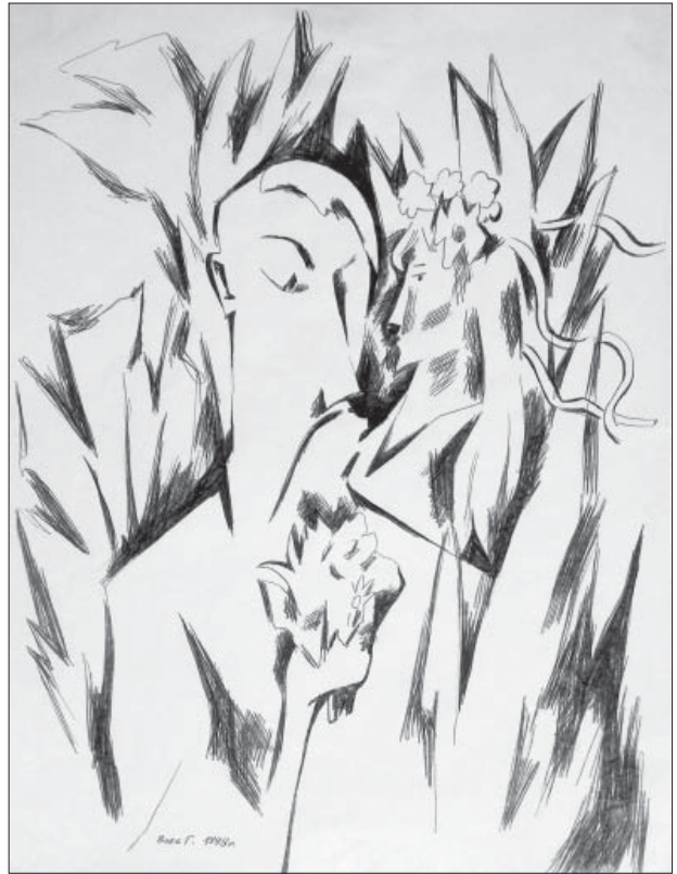
Григорій Вовк. Кохання. Папір, кулькова ручка, 29x20. 1998

Найбільше натхнення для автора – Біблія, він і вважає себе релігійним митцем, а у творчості постійно звертається до найголовнішої книги людства. Ціла серія картин – "Пророк Єремія" (2010), "Пророк" (2010), "Погляд пророка" (2011) "Мовлячий пророк" (2011) та ін. – засвідчують трепетне ставлення митця до образів