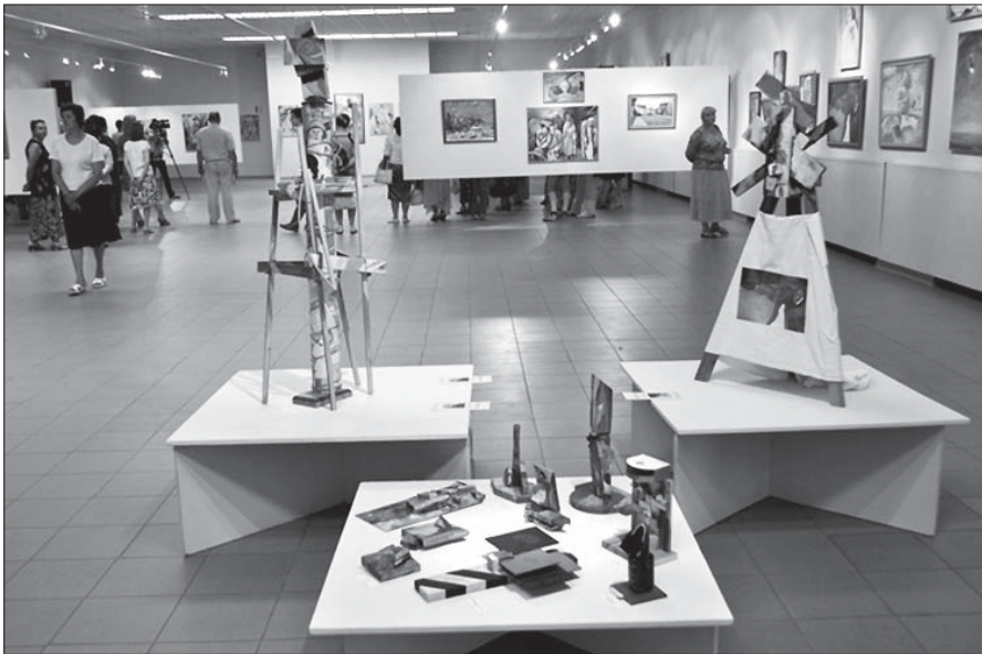
20-та виставка творів Г. Вовка. Галерея мистецтв Полтавського художнього музею імені Миколи Ярошенка. 2012

Філософія творчості Григорія Вовка, якою він щедро ділиться з глядачем, ґрунтується на тісній взаємодії мистецтва й життя, на безперестанному пошуку нових форм мистецького