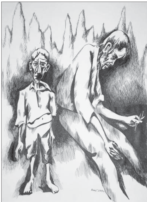
Григорій Вовк. Голодомор. Папір, туш, 29x41. 2007

Художній світ обдарованого земляка тематично багатогранний і різноманітний, діапазон змістового вираження так само доволі широкий: