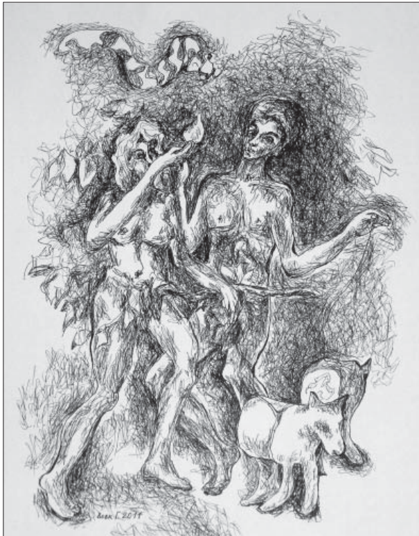
Григорій Вовк. Адам і Єва. Папір, гелева ручка, 29x20, 5. 2011

Ізсохне лютість і замовкне гомін, Уляжеться в полоні давніх мрій, Зігріє душу на світанку промінь, Туман застелить простором подій. Пожухнуть зливи – вітер пожовтіє, І на траві кришталіки роси Зігріють подихом духовної надії Натхнення радості від Божої краси.