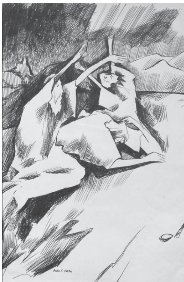
Григорій Вовк. Молитва. Папір, кулькова ручка, 27х21. 1998

Його живопис відзначається гармонійністю. Митець не акцентується на якісь своїй палітрі. У його творчості є теми, що відображають смуток, тому й кольори дають змогу задуматися, несуть певний трагізм. Все залежить від ідеї та задуму. Власною творчістю Григорій Вовк хоче змусити глядача не просто сприймати звичні речі та споглядати картини, а мислити активно, співпереживати. Низка полотен – дуже символічні: “Вибір” (2010), “Істина” (1992), “Освітлене обличчя” (2009), “Музика щастя” (2011), “Безперервний рух” (1989), “Нема віку” (2011), “Державний кордон особистості” (1994), “30-ті роки” (1988). Кандидат культурологічних