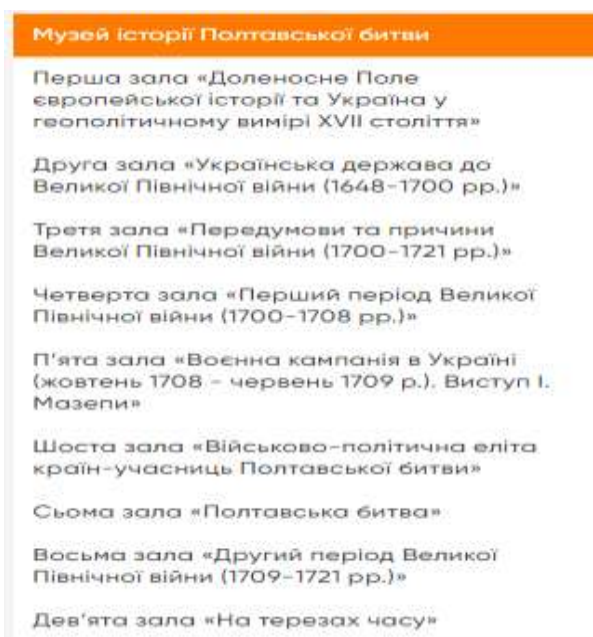
Рис. 2. Експозиції музею «Поле Полтавської битви» [6]

Експерсії, які проводяться у музеї «Поле Полтавської битви» подано на рис. 3 [7].