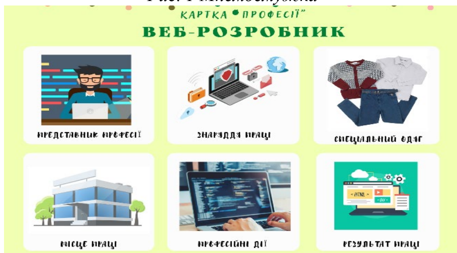
Рис. 2 Мнемокарта