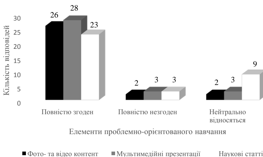
Рис. 2. Оцінка студентами окремих елементів проблемно-орієнтованого навчання

На рис. 2 наведено результати оцінки студентами окремих елементів проблемно-орієнтованого навчання.