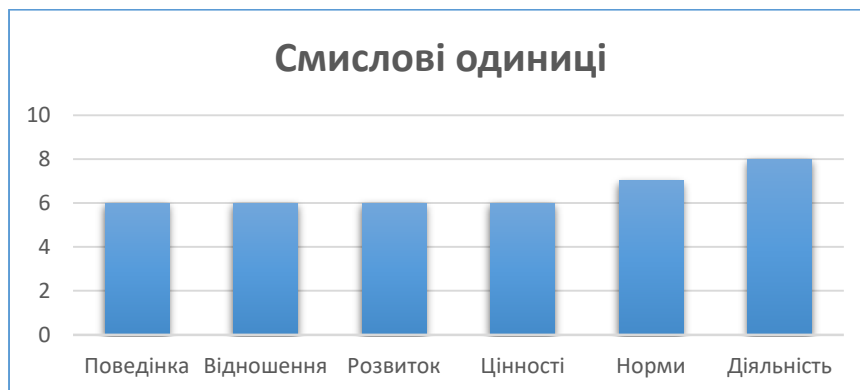
Рис. 1. Основні смислові одиниці визначень культури безпеки

Виявивши частоту повторень даних смислових одиниць, визначено основні з них, які в свою чергу складають семантичне ядро досліджуваних визначень. Так аналіз дозволяє сформулювати такі основні смислові одиниці терміну «культура безпеки»: діяльність, норми, цінності, ставлення, поведінка, розвиток (рис 1).