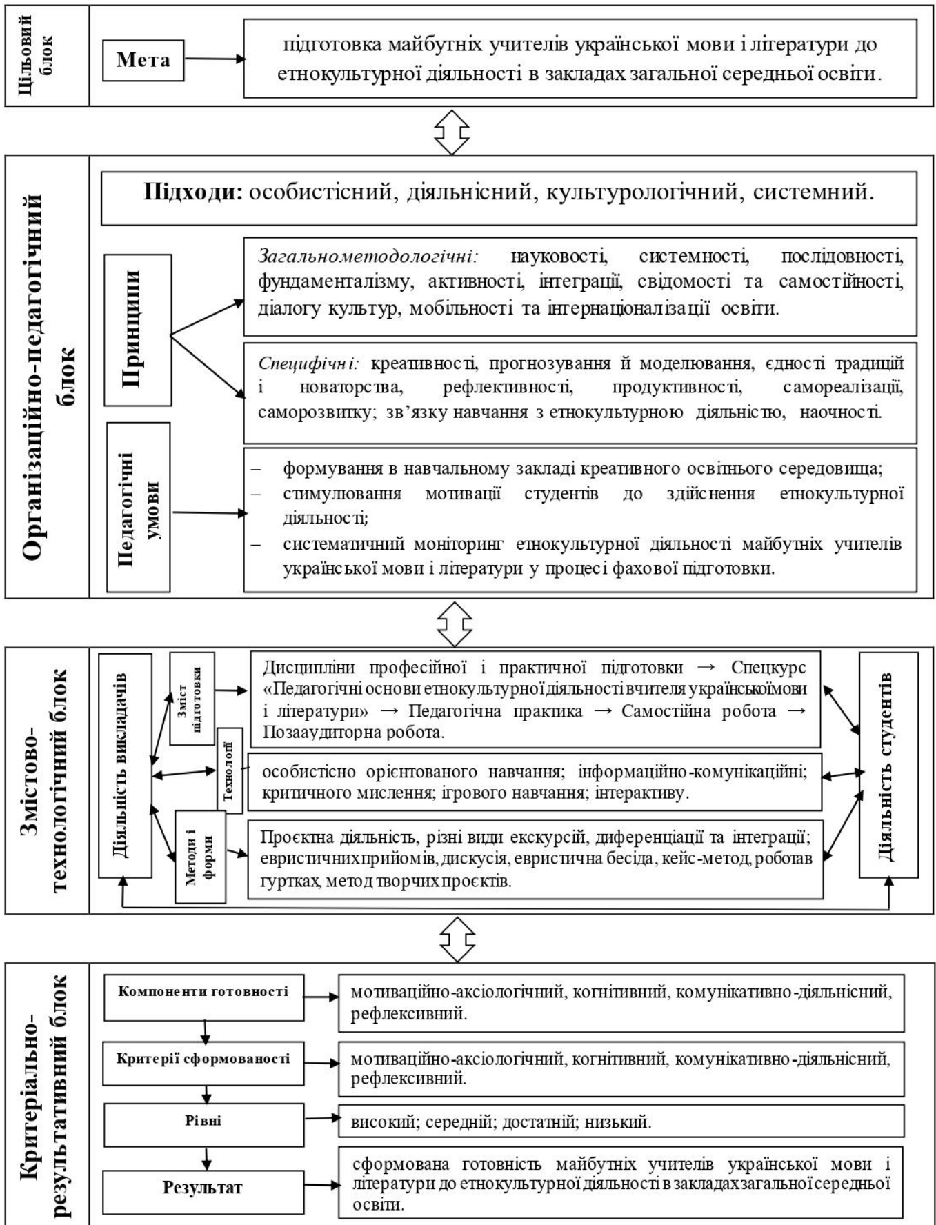
Рис. 2.1. Педагогічна модель готовності майбутніх учителів української мови і літератури до етнокультурної діяльності в закладах загальної середньої освіти