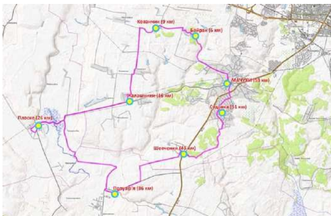
Рис. 1. Туристично-рекреаційний маршрут селами Мачухівської ТГ [карта розроблена автором]

Розпочати маршрут варто з центру села Мачухи, де знаходиться кращий музей і арка закоханих (рис. 1). Наступний об'єкт, який припаде до душі туристам – це єдиний в Україні Інтерактивний музей олії. По дорозі до музею можна відвідати храм Іоанна Богослова, збудований у ХХІ столітті стараннями протоієрея Василя Патроша. Далі ми помандруємо до села Плоске, в якому розташований музей Олександра Ковіньки з мальовничим парком, який носить ім'я українського письменника-поета Анатолія Кириловича Григоренка. Подальший маршрут пролягатиме до села Полузир'я, в якому є народний музей вишитої картини. Найстарішому екземпляру цього музею більше ста років.