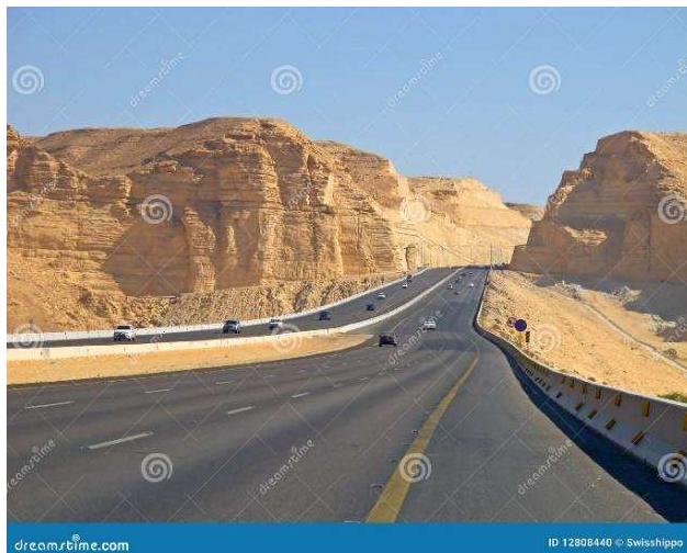
Рис.2. Дорога Ганді [3]

На титул місця, де хрестився Ісус Христос, в Ізраїлі є два претендента. Перший – Йорденіт, неподалеку від витоку річки Йордан з озера Кінерет. Довгий час саме це місце зазначалося в усіх туристичних довідниках Ізраїлю. Воно і в дійсності дуже приємне, особливо після подорожі пустелями півдня країни: тут є і невелика річка з лісом на її берегах, і зухвалі нутрії, що випрошують корм у туристів (рис.3). Але історики і богослови впевнені, що ця видатна подія відбувалася значно південніше, при впадінні річки у Мертве море – в Каср-ель-Яхуд (на кордоні Ізраїлю та Йорданії). Сьогодні тут теж є купальні. Куди їхати – вирішувати самим туристам.