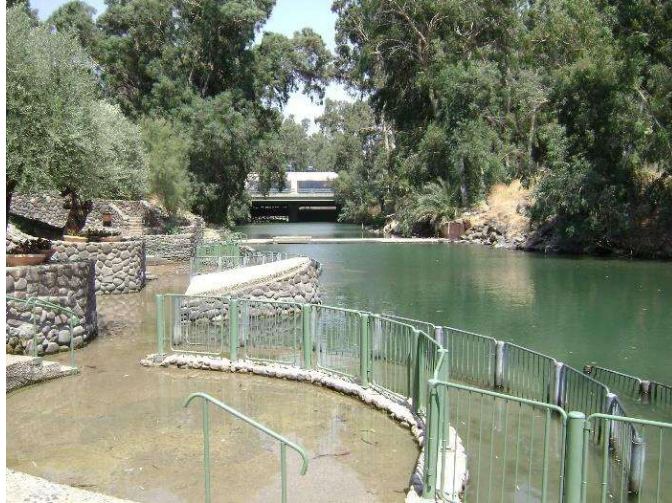
Рис.3. Купальня у Ярдєніті [4]

У біблійних текстах озеро Кінєрет (в Ізраїлі його ще називають Галілейським морем та Тивєріадським озером) фігує постійно. З ним пов'язані численні епізоди з життя Христа та його помічників – апостолів Петра та Андрія. Дві тисячі років тому ця місцевість виглядала інакше: узбережжя було пустельним, отже, саме сюди Ісус приходив для усамітнення. Саме тут Він нагодував «п'ять тисяч мужів окрім жінок та дітей» п'ятьма хлібами та двома рибами. Містечко Табха, де це все відбувалося, і знаходиться на березі Галілейського моря по трасі «Дороги Ганді». Нині ж у Табхі туристів зустрічають декілька католицьких церков, що збудовані порівняно недавно, а територія навколо них являє собою доглянутий парк.