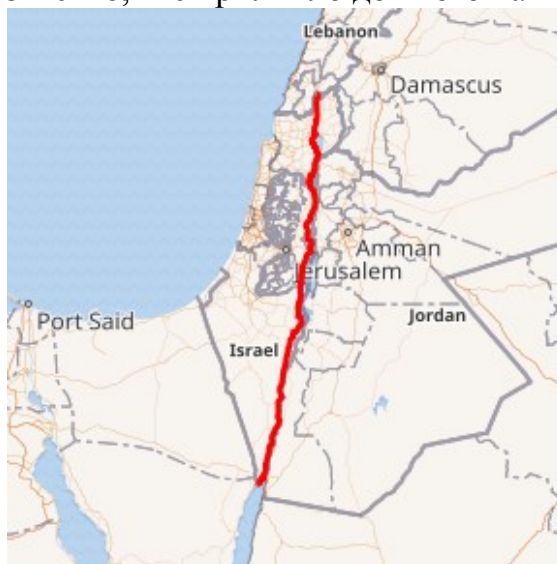
Рис.1. Шосе 90 (Дорога Ганді) [1]

А от у його зовнішності, мабуть, якась подібність до індійського Ганді була. Розказують, що за молодих років під час військової служби Зеєві поголив голову, замотав її рушником і в такому вигляді з'явився на публіці, – в результаті і отримав прізвисько, яке прилипло до нього на все життя.