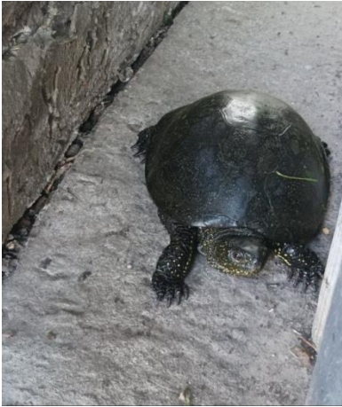
Рис. 2. Фото болотної черепахи, яка вирощується у приватній водоймі, Кременчуцький район. Довжина карапаксу 20 см, вага 950 г.

Проте дане питання потребує подальшого опрацювання та аналізу: розглядається доцільність, часові межі, рентабельність та особливості облаштування території для розведення черепах, можливість транспортування та заселення у водойми. Необхідно врахувати, що суттєве значення у просторовому розподілі популяцій черепах має наявність води, віддаленість біогеоценозу від води, ступінь зволоження, структура насаджень і зімкнутість крон дерев.