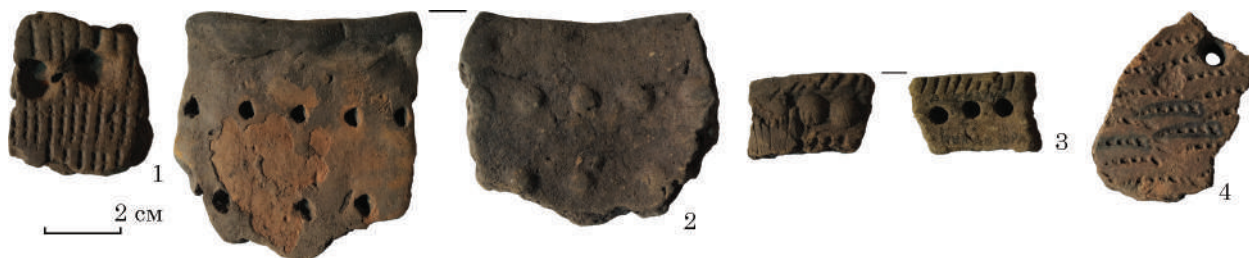
Рис. 1. Фрагменти стінок посудин. Глина, ліплення, вдавнення. Макухівка, ур. Біла гора. Тип Засуха. Розвідки Івана Післарія. ПКМВК, інв. № 1 — ПКМ 30489 А2273; 2 — ПКМ 30489 А2273; 3 — ПКМ 30489 А2273/49; 4 — ПКМ 30489 А2273