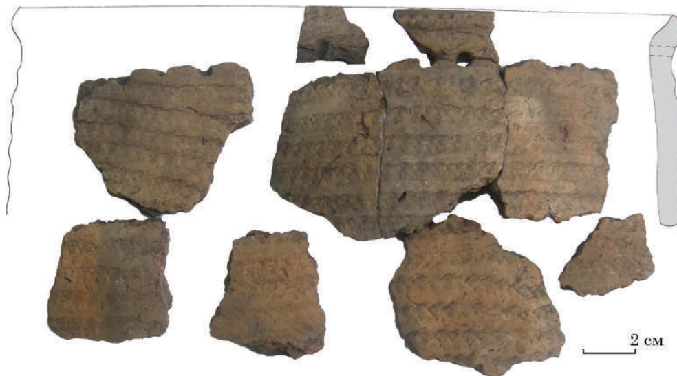
Рис. 5. Реконструкція верхньої частини горщика. Глина, ліплення, вдавнення. Клюсівка, ур. Татарський бугор. Тип Засуха. Розкопки О. Коваленко. НМЗУГ, інв. № НДА 16390, 16551, 16548

Орнаментация цієї групи така: під краєм вінця не наскрізні проколи, що з внутрішнього боку утворюють невеликі «перлини» (крім того, що на рис. 8, або наскрізні проколи). Поверхня добре заглажена, до лискування.