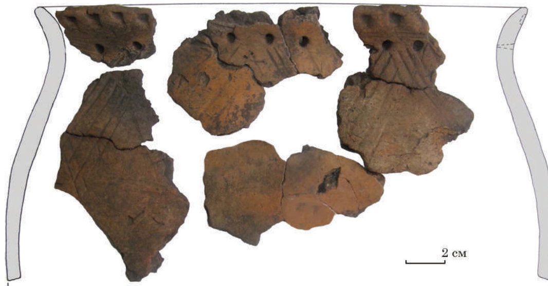
Рис. 3. Реконструкція верхньої частини горщика. Глина, ліплення, вдавнення. Клюсівка, ур. Татарський бугор. Тип Засуха. Розкопки Оксани Коваленко. НМЗУГ, інв. № НДА 17068, 15229, 17115