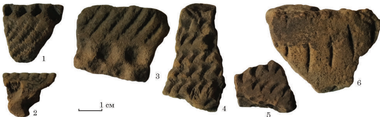
Рис. 2. Фрагменти стінок горщиків. Глина, ліплення, вдавнення. Макухівка, ур. Біла гора. Неоліт, енеоліт. Розвідки Івана Післарія. ПКМВК, інв. № ПКМ 30489 А2273

1988, с. 79, 80; 1973, рис. 61: 11; Телегін, Титова 1998, с. 62; Рассмакін 2013, с. 35; Берестнев 2004, с. 120). Щоправда, матеріали з пам'ятки Верьовкіне 14, та поховання 10—14, 17 з поселення Олександрія, на відміну від Д. Телегіна, Н. Котова зараховує до верьовкінської групи пам'яток Маріупольської культурно історичної області (Котова 1994, с. 45).