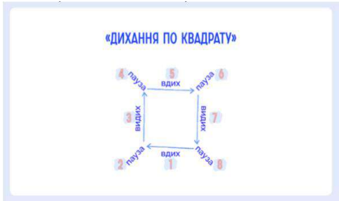
Рис.1. Дихання по квадрату

Таким чином людина починає контролювати своє дихання. Також це і тактильні відчуття – людина починає відчувати своє тіло.