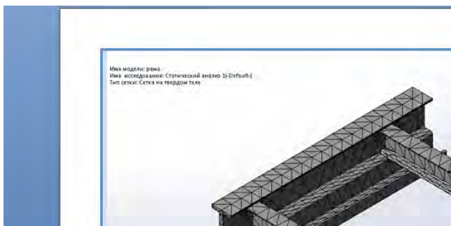
Рис. 1. Сітка кінцевих елементів для рами кронблока.

З допомогою програми SolidWorks моделюємо реальне середовище. Прикладаємо до крон блока зусилля, яке би діяло на них на буровій, та випробовуємо його. Наглядний приклад експерименту покажемо у вигляді зображень.