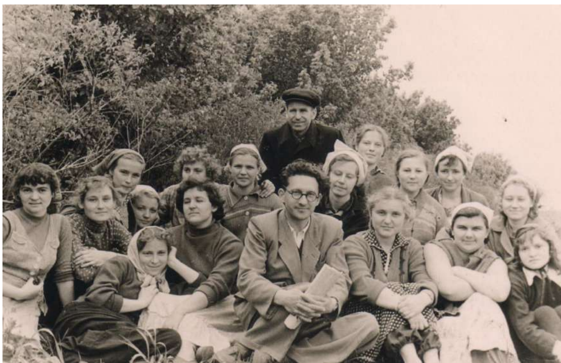
Фото Полтавського державного педагогічного інституту ім. В. Г. Короленка (60 рр. XX століття)