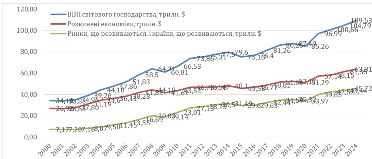
Рис. 1. Зміна обсягу ВВП у світовій економіці та у розрізі розвинених країн та ринків і країн, що розвиваються за 2000-2024 рр., трилн. $

За 23 роки у XXI столітті спостерігаємо динамічне зростання ВВП у світовій економіці, яке становить на 1 квітня 2024 року 109,53 трилн. $. У порівнянні з 2000 роком, який було обрано за базу, ВВП світової економіки зріс на 321,2 %. Проте, порівнюючи зміну обсягів ВВП, який утворюється в розвинених країнах та ВВП, що утворюється на ринках і в країнах, що розвиваються, спостерігаємо значний дисбаланс. Темпи приросту ВВП розвинених